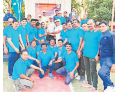
పోలీస్ జిల్లా మొదటి బహుమతి అందజేస్తూ..