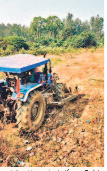
భూపాలపల్లి జిల్లా కేంద్రంలో కాంగ్రెస్ నేత ట్రాక్టర్ తో చదును చేయించిన ప్రభుత్వ భూమి