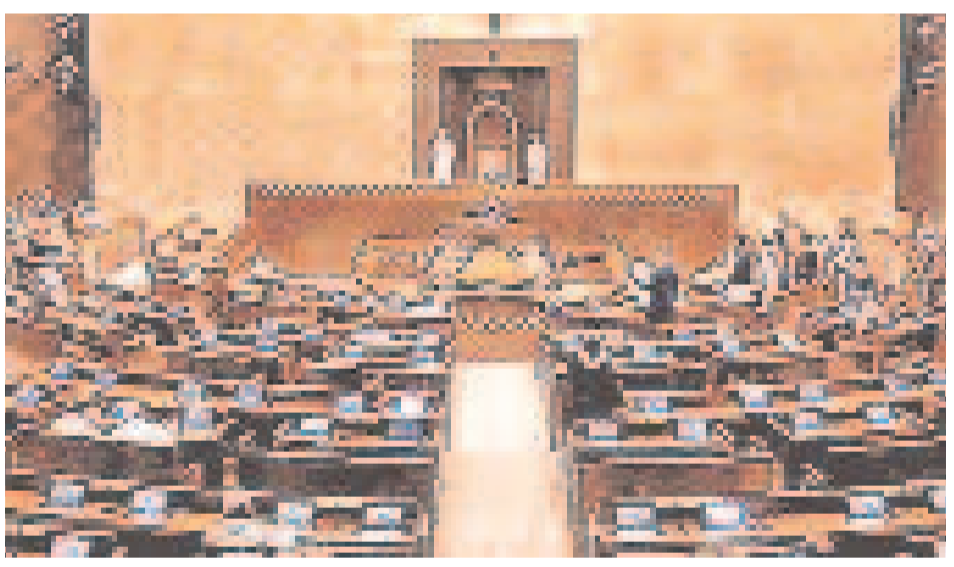
వివక్షల ఆందోళనల నడుమ కొనసాగుతున్న రాజ్యసభ కార్యకలాపాలు

అమెరికాలోనే హెచ్ 1 బీ వీసాల రెన్యూవల్ ఫైట్ ప్రోగ్రామ్ కు ఓవర్ లాండ్ ఈ నెల 15 న ఆమోదం > 11 తొలుత 20 వేల వీసాలు భారతీయులకు ప్రయోజనం తెలంగాణ మరో 900 కోట్ల అప్పు బాండ్ల విక్రయాల ద్వారా ఆర్థిక సుస్థిరం > 2