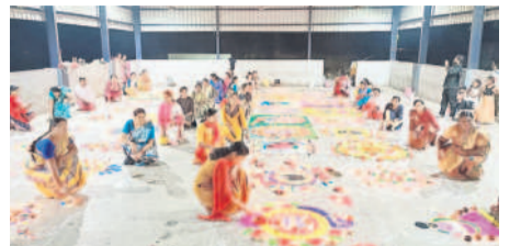
మందమలలో దీపాలను వెలిగిస్తున్న మహిళలు