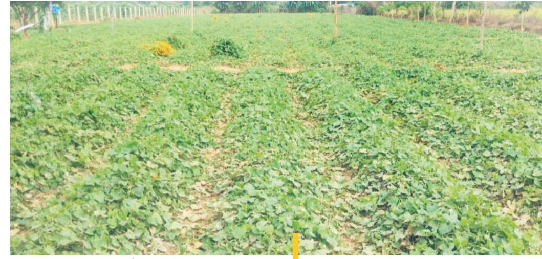
బెంగాళి రైతులు సాగు చేసిన పచ్చల్ పంట