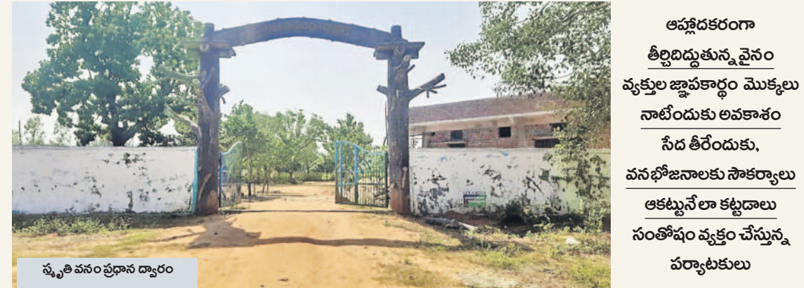
స్మృతి వనం ప్రధాన ద్వారం