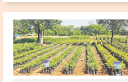
వివిధ రకాల మొక్కలు