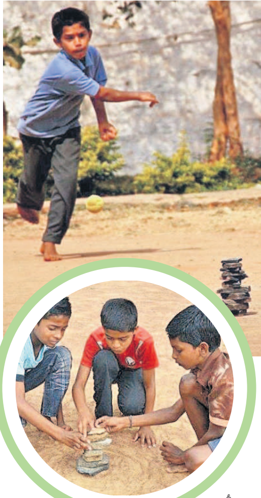
గ్రామీణ ప్రాంతాల్లో కొద్దో గొప్పో ప్రాచీన ఆటలు

దేహధూళి, కవ భారం, నోళ్ల వ్రేకులు, పాల బుగ్గలూ, ఎక్కడ చూస్తే అక్కడ మీరై విశ్వ రూపమన విహారిస్తుండే సరమా తల్లులు ఓ చిరుతల్లారా... మీదే మీదే సమున్న విశ్వం.. మీరే లోకపు భాగ్య విదాతలు అని శ్రీశ్రీ అన్నట్లు చిన్న పిల్లలు తమ న్నహితులతో దుమ్మునకా, దూశనకా, వెలుగు చీకట్లను లెక్క చేయకుండా తాము విహరించే ప్రతి ప్రదేశం తమదే అనుకొనే బాల్యం ప్రతి ఒక్కరికీ ఓ మధుర స్మృతి. ఆలాంటి బాల్యంలో ఆడిన ఆటలు, చేసిన చేష్టలు మరపురాని తీయని భావనలు. వాటిని నెమరవేసుకుంటున్న గత, నేటి తరాలు. మరి భవిష్యత్ తరాల మాటిమిటి..? -యాలం, డిసెంబర్ 19