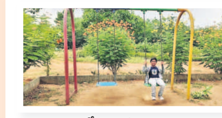
వనంలో ఆడుకుంటున్న బాలుడు