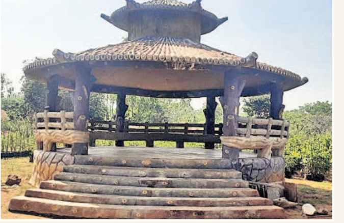
కూర్చోదానికి ప్రత్యేకంగా ఏర్పాటు చేసిన స్థలం

ధారూరు, డిసెంబర్ 19 : మనిషి మనుగడకు మొక్కలే జీవనాధారం మొక్కల పెంపకంతోనే పర్యావరణ పరిరక్షణ సాధ్యమవుతుంది. ప్రతిఒక్కరూ బాధ్యతగా మొక్కలు నాటి వాటిని సంరక్షించాలి. ఆత్మీయుల జ్ఞాపకార్థం మొక్కలు పెంచితే ఆ ఆనందాన్ని తీసుకోవచ్చు. అందుకే ప్రభుత్వం వికారాబాద్లో కల్పిస్తున్నది. ఆత్మీయుల జ్ఞాపకాలు చెదిరిపోకుండా ఉండడానికి స్మృతివనం ఏర్పాటు చేశారు. వనభోజనాలు చేయడం పచ్చనిచెట్లతో ఆహ్లాదకరంగా ఏర్పాటు చేసి సేద తీరడం ఇక్కడి ప్రత్యేకత. అటవీశాఖ ఆధ్వర్యంలో ధారూరు మండల కేంద్రం సమీపంలో స్మృతివనం ఏర్పాటు చేసి మృతి చెందిన ఆత్మీయుల పేరట మొక్కలు నాటి కార్యక్రమాన్ని చేపట్టింది. ఇందుకోసం స్మృతివనాన్ని ఆహ్లాదకరంగా తీర్చిదిద్దుతున్నారు. వికారాబాద్ జిల్లా ధారూరు మండల కేంద్రంలోని సోమశంకరస్వామి ఆలయం సమీపంలో వికారాబాద్-తాండూరు ప్రధాన రహదారి పక్కనే స్మృతివనాన్ని మూడు సంవత్సరాల క్రితం 12ఎకరాల 20గుంటల్లో స్మృతి వనాన్ని ఏర్పాటు చేశారు. అటవీ శాఖ ఆధ్వర్యంలో అప్పటి వికారాబాద్ కలెక్టర్ ఒ.మ. రెడ్డి రూ.12లక్షలు స్మృతి వనం అభివృద్ధికి మంజూరు చేశారు. ఈ నిధులతో స్మృతి వనంలో ఆహ్లాదకర వాతావరణం ఉండేలా ఏర్పాటు చేశారు. అందమైన కట్టడాలు, పర్యాటకులు సేద తీరడం కోసం చెట్ల దగ్గర చిన్న చిన్న కట్టలు నిర్మించారు.