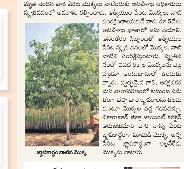
జ్ఞాపకార్థం నాటిన మొక్క