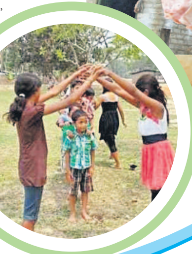
పిల్లలూ తమ సమయాన్ని కూడా ఉపయోగిస్తూ, స్పార్ట్ ఫోన్, లావీ టాఫుల వైపు కేటాయింపడంతో ఆటల వైపు వారి దృష్టి వెళ్లేడం లేదు.

వెలితే అవి చేస్తాయి. ఆలా నేటి పిల్లలు ఇంటికి, బడికి మాత్రమే పరిమితం అవుతున్నారు. పెద్దలూ పిల్లలతో మాట్లాడే సమయం లేక పిల్లలతో ఆడుకోవాలనే ఆలోచన లేక ఉద్వేగ సంబంధ విరాళాలతో స్పార్ట్ ఫోన్తో డోస్టీ చేయడంతో వారి పిల్లలూ తమ సమయాన్ని కూడా ఉపయోగిస్తూ, స్పార్ట్ ఫోన్, లావీ టాఫుల వైపు కేటాయింపడంతో ఆటల వైపు వారి దృష్టి వెళ్లేడం లేదు. క్రమంగా క్రీడలు అంతం రింది పోతున్నాయి. కంటి సమస్యలతో పాటు మానసిక శారీరక సమస్యలు తలెత్తుతున్నాయి.