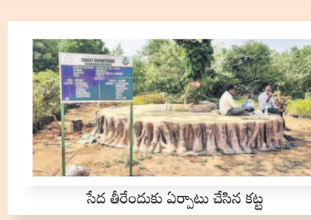
సేద తీరేందుకు ఏర్పాటు చేసిన కట్ట

మొక్కలు నాటిన వారి కోసం ప్రత్యేక ఏర్పాటు చేస్తున్నారు. చుట్టూ అడవిని ఆశ్రయిస్తూ చల్లని గాలిని వీలుస్తూ వన భోజనాలు చేసేందుకు వీలు కల్పిస్తున్నారు. ఈ స్మృతి వనంలో ప్రధాన గేట్, రస్ట్రబండలు, బోరు, మోటరు, వైవ్ లైన్, గజబోను లను నిర్మించారు. స్మృతివనం చుట్టూ రెండు మీటర్ల లోతు, వెడల్పుతో పహారీ(జాలిలతో)కాకుండా కంచకాలు తవ్వివారు. స్మృతివనంలో ధారాపూ 1.8లక్షల వివిధ రకాల మొక్కలను పెంచుతున్నారు. స్మృతివనానికి వేసేవ కాలంలో అధికంగా వస్తుంటారని స్థానికులు తెలుపుతున్నారు.