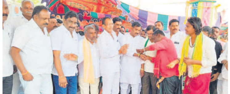
యాదగిరిగుట్ట : పెద్దకందుకూరులో ఎల్లమ్మతల్లికి పూజలు చేసి చేతికి కంకణం కట్టించుకుంటున్న ప్రభుత్వ విప్ బిర్ల అయిలయ్య

యాదగిరిగుట్ట, డిసెంబర్ 19 : శ్రీనిమ్మగుండ్ల ఎల్లమ్మతల్లికి ప్రభుత్వవిప్, ఆలేరు ఎమ్మెల్యే బిర్ల అయిలయ్య ప్రత్యేక పూజలు జరిపారు. మంగళవారం మండలంలోని పెద్దకందుకూరు గ్రామంలో ఎల్లమ్మతల్లిని దర్శించుకున్నారు. ఈ