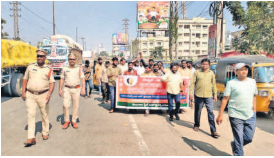
మేడ్చల్లో నిరసన ప్రదర్శన నిర్వహిస్తున్న ఆటో డ్రైవర్లు