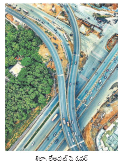
శిల్పా లేఅవుట్ పై ఓవర్