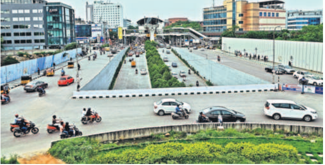
కేసీఆర్ ప్రభుత్వం హయాంలో నిర్మించిన రాయదుర్గంలోని అండర్పాస్

సిటీబ్యూరో, డిసెంబర్ 20 (నమస్తే తెలంగాణ) : ఒకవైపు నిధుల సమీకరణ.. మరోవైపు అభివృద్ధికి బాటలు వేస్తూ కేసీఆర్ ప్రభుత్వం దేశంలోనే హైదరాబాద్ ను అదర్సవంతంగా తీర్చిదిద్దింది. హైదరాబాద్ నగరాన్ని విశ్వ నగరంగా మార్చే చర్యల్లో గతంలో ఎన్నడూ లేని విధంగా మౌలిక సదుపాయాల కల్పనకు పెద్ద పీట వేసింది. ఒక్కమాటలో చెప్పాలంటే ఒక్క పై ఓవర్ కట్టాలంటే ఉమ్మడి రాష్ట్రంలో ఏండ్లకు ఏండ్ల సమయం పట్టింది. కానీ కేసీఆర్ ప్రభుత్వం హయాంలో కేవలం ఏనిమిదిన్నరేళ్లలో 36 ప్రాజెక్టులను అందుబాటులోకి తీసుకువచ్చి భవిష్యత్ తరాలకు చెక్కు చెదరని ఆస్తిగా మలిచింది. 2015 సంవత్సరంలో రూ.5112.36కోట్ల అంచనా వ్యయంతో 47 ప్రాజెక్టులు చేపట్టగా.. 36 ప్రాజెక్టులు 20 పై ఓవర్లు, ఐదు అండర్పాస్లు, ఏడు ఆర్వోబీ/ఆర్యూబీలు, కేబిల్ బ్రిడ్జి, మరో మూడు ఇతర ప్రాజెక్టులను అందుబాటులోకి తెచ్చి ట్రాఫిక్ సుడిగుండాలకు శాశ్వతంగా చెక్ పెట్టారు.