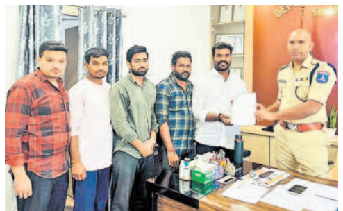
డీసీపీకి వినతి పత్రం ఇస్తున్న బీఆర్ఎస్ యువనాయకులు