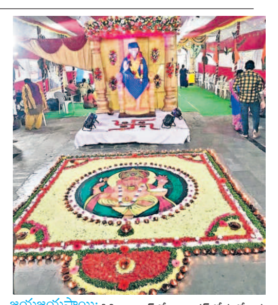
జయజయసాయి: <sub>సికిందా</sub>బాద్లోని మినిస్టర్ రోడ్డలో ఉన్న సాయిబాబా ఆలయంలో గత ఎనిమిది రోజులుగా శ్రీసాయి..జయ సాయి నామ స్మరణతో ట్రత్యేక పూజలు నిర్వహిస్తున్నారు. బుధవారం సాయిబాబాను, ఆలయ పరిసరాల్లో వివిధ రకాల పూలతో అలంకరించి పూజలు నిర్వహించారు.