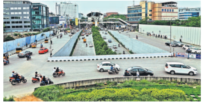
కేసీఆర్ ప్రభుత్వం హయాంలో నిర్మించిన రాయదుర్గంలోని అండర్పాస్

సిటీబ్యూరో, డిసెంబర్ 20 (నమస్తే తెలంగాణ) : ఒకవైపు నిధుల సమీకరణ.. మరోవైపు అభివృద్ధికి బాటలు వేస్తూ కేసీఆర్ ప్రభుత్వం దేశంలోనే హైదరాబాద్ ను అదర్శవంతంగా తీర్చిదిద్దింది. హైదరాబాద్ నగరాన్ని విశ్వ నగరంగా మార్చే చర్యల్లో గతంలో ఎన్నడూ లేని విధంగా మౌలిక సదుపాయాల కల్పనకు పెద్ద పీట వేసింది. ఒక్కమాటలో చెప్పాలంటే ఒక్క పై ఓవర్ కట్టాలంటే ఉమ్మడి రాష్ట్రంలో ఏండ్లకు ఏండ్ల సమయం పట్టింది. కానీ కేసీఆర్ ప్రభుత్వం హయాంలో కేవలం ఏనిమిదిన్నరేళ్లలో 36 ప్రాజెక్టులను అందుబాటులోకి తీసుకువచ్చి భవిష్యత్ తరాలకు చెక్కు చెదరని ఆస్తిగా మలిచింది. 2015 సంవత్సరంలో రూ.5112.36కోట్ల అంచనా వ్యయంతో 47 ప్రాజెక్టులు చేపట్టగా.. 36 ప్రాజెక్టులు 20 పై ఓవర్లు, ఐదు అండర్పాస్లు, ఏడు ఆర్వోబీ/ఆరియూబీలు, కేబిల్ బ్రిడ్జి, మరో మూడు ఇతర ప్రాజెక్టులను అందుబాటులోకి తెచ్చి ట్రాఫిక్ సుడిగుండాలకు శాశ్వతంగా చెక్ పెట్టారు.