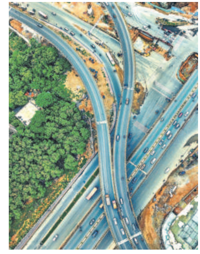
శిల్పా లేఅవుట్ పై ఓవర్