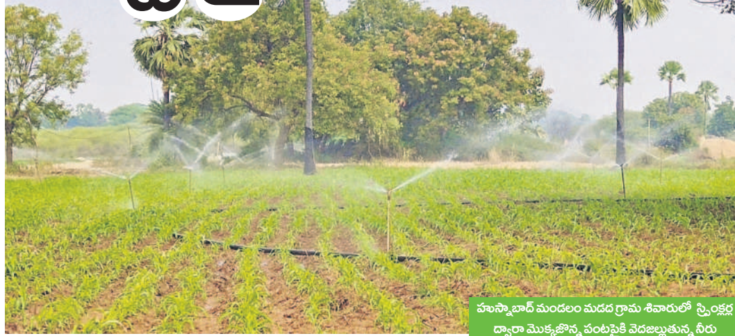
హసన్పూర్ మండలం మడద గ్రామ శివారులో స్ప్రింకల్ల ద్వారా మొక్కజొన్న పంటపెండ్లను నీరు

హసన్పూర్, డిసెంబర్ 20 : వ్యవసాయ రంగంలో వస్తున్న ఆదు చేక పోకడలను రైతులు అనుకరిస్తున్నారు. సులభ పద్ధతుల్లో వ్యవసాయ చేయడం, తక్కువ ఖర్చు, శ్రమతో ఎక్కువ దిగుబడులు సాధించాలనే లక్ష్యంతో ముందుకు వెళ్తున్నారు. తక్కువ నీటితో ఎక్కువ విస్తీర్ణంలో పంటల సాగు చేసుకునేందుకు సూక్ష్మ, తుంపర సేద్యం ఎంతో దోహద పడుతుంది. సాగునీటి ఎద్దడి ఉండే మెట్ట ప్రాంతాల్లో తుంపర సేద్యం వైపు రైతులు మొగ్గ చూపుతున్నారు. ముఖ్యంగా మెట్ట ప్రాంతాల్లో తుంపర సేద్యం ద్వారా రైతులు అధిక లాభాలను అర్జించే అవకాశం ఉంది. రైతులను తుంపర సేద్యం వైపు మళ్లించేందుకు ప్రభుత్వం కూడా సబ్సిడీలు ఇచ్చి అందుకు సంబంధించిన పరికరాలను అందిస్తోంది. ఆరుతడి పంటలైన వేరుశనగ, శనగ, మొక్కజొన్న, బబ్బెర, కందులు, పెసర, పత్తి, పలు కూరగాయలు, ఆకుకూర పంటలను తుంపర సేద్యం ద్వారా విరివిగా పండించవచ్చని వ్యవసాయ అధికారులు చెబుతున్నారు. తుంపర సేద్యం డ్రైప్, స్ప్రింకల్ల వాడకం ముఖ్యమైనవి చెప్పా చ్చు. డ్రైప్ విధానంలో పంటలోని ప్రతి సాలుకు నచ్చని పైపు అమర్చి ఒక్కో చక్క నీరు మొక్క మొదలలో పడేలా చేయడం, స్ప్రింకల్ల విధానంలో పంటలో రైట్ పైపులు వేసి స్ప్రింకల్ల హెడ్ ద్వారా నీటిని విర జిమ్మి పంటకు నీరందించడం జరుగుతుంది.