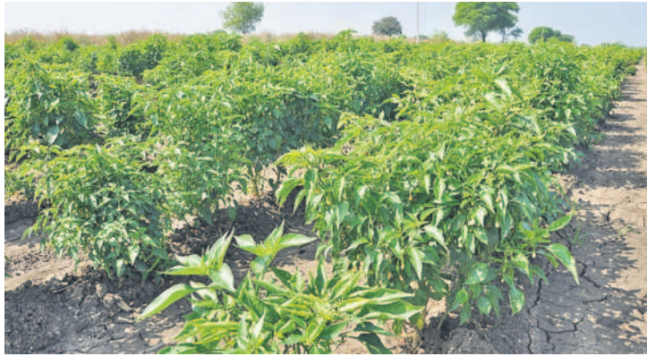
జహీరాబాద్ పట్టణ శివారులో రైతులు సాగుచేస్తున్న పద్దిమర్రి, టమాట