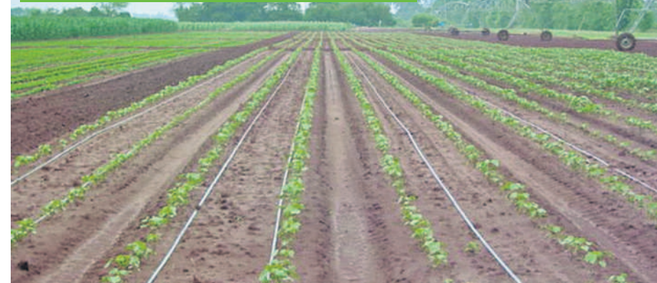
హసన్పూర్ పట్టణ శివారులో డ్రైప్ ద్వారా పత్తి పంటకు నీరందింపున, దృశ్యం

స్ప్రింకల్లను మూడు విధాలుగా పంట పొలాల్లో అమర్చుకునే అవ కాశం ఉంది. శాశ్వతంగా పైపులను భూమిలో పాతిపెట్టి స్ప్రింకల్ల హెడ్ లను అమర్చి నీటిని విరజిమ్ముడం మొదటి విధానం అయితే కొన్ని పైపు