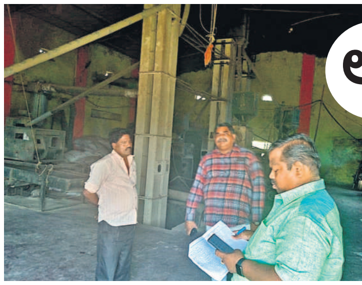
రామాయపేటలో రైసుమిల్లును తనిఖీ చేస్తున్న పౌరసరఫరాల శాఖ అధికారులు

జహీరాబాద్, డిసెంబర్ 20: యాసంగిలో అన్నదాతలు ఆరుతడి పంటల సాగు వైపు మొగ్గ చూపుతున్నారు. వానకాలంలో పుష్పలంగా వానలు కురవడంతో వ్యవసాయ బావుల్లో నీరు ఉండడంతో ఆరుతడి పంటలు జోరుగా సాగుచేస్తున్నారు. జహీరాబాద్ వ్యవసాయ శాఖ డివిజన్ లో వానకాలంలో రైతులు అధికంగా పత్తి, కంది, మొక్కజొన్న, సోయా పంటలు సాగు చేశారు. రెండో పంట సాగు చేసేందుకు భూములు సిద్ధం చేసి సాగు చేస్తున్నారు. ప్రకృతి సిద్ధంగా పడే శనగ, జొన్న పంటలు అధికంగా సాగు చేస్తున్నారు. మరెంతో మొక్కజొన్న, కూరగాయలు సాగు చేస్తున్నారు. వాతావరణం అనుకూలంగా ఉండడంతో రైతులు ఆరుతడి పంటలు సాగు చేస్తున్నారు. రైతులు యాసంగిలో పంట మార్పిడి చేసి, కొత్త పంటలు సాగు చేస్తున్నారు. ఎర్ర నేలలు వాణిజ్య, ఆకుకూరలు, కూరగాయలకు అనుకూలంగా ఉండడంతో రైతులు ఆరుతడి పద్ధతుల్లో సాగు చేస్తున్నారు. సంప్రదాయ పద్ధతుల్లో కాకుండా కొత్త పద్ధతుల్లో బిందుసేద్యం ద్వారా పంటలు పండిస్తున్నారు. అంతర పంటల కూరగాయలు సాగు చేస్తున్నారు. వేసవిలో భారీ అమ్మకాలు జరిగే పుభకాలులు సాగు చేస్తున్నారు. బొప్పాయి, ఆకుకూరలు, కూరగాయలు పండించేందుకు రైతులు ఆసక్తి చూపుతున్నారు. అధికంగా ఆదాయం వచ్చే వాణిజ్య పంటల సాగుపై అన్నదాతలు ఆసక్తి చూపిస్తున్నారు.