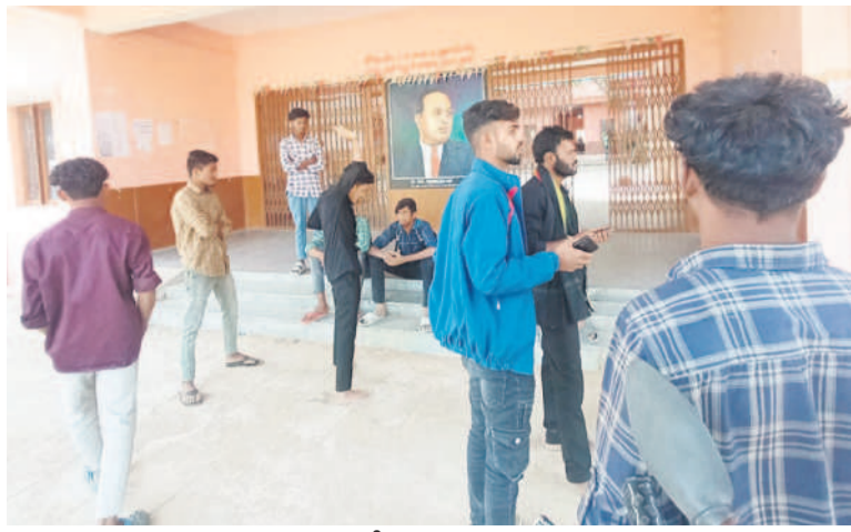
ఉటూర్ డిగ్రీ కళాశాల ఎదుట విద్యార్థులు