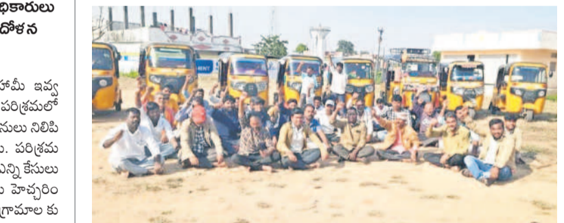
ఉటూర్ రూరల్ : రింగ్ జతండాలో నిరసన వ్యక్తం చేస్తున్న ఆటో యూనియన్ సభ్యులు