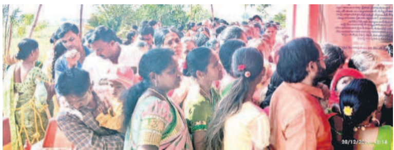
కోతి దేవుడి దర్శనానికి క్యూలైన్లో నిలబడ్డ భక్తులు

190 యూనివర్సిటీ ఫీజు చెల్లించామని, కళాశాల యాజమాన్యం తమ ఫీజును కాకతీయ యూనివర్సిటీలో చెల్లించకపోవడంతో హాల్ టీకెట్లు రాలేదని ఆవేదన వ్యక్తం చేశారు. ఫీజు చెల్లించిన రకీ దులు కూడా ఉన్నాయని పేర్కొన్నారు. కళాశాల యాజమాన్యం తప్పిదంతో ఈ యేడాది నష్టపోవాల్సి వస్తున్నది తెలిపారు. ఈ విషయంపై ప్రిన్సిపాల్ ను నిలదీయగా సస్టిమెంటరీ పరీక్ష రాయమని తామని పేర్కొన్నాడని తెలిపారు. ఈ విషయంపై ఉన్నతాధికారులకు ఫిర్యాదు చేస్తామని విద్యార్థులు చెప్పారు.