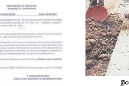
ఖైదానా పట్టణంలో ఎన్ డిఎఫ్ నిధులతో చేపట్టిన సీసీ రోడ్డు (ఫైల్)

నిర్మల్, డిసెంబర్ 20 (నమస్తే తెలంగాణ) : స్పెషల్ డెవలప్ మెంట్ ఫండ్ (ఎన్ డిఎఫ్) కింద చేపట్టిన అభివృద్ధి పనులు నిలిపేయాలని కాంగ్రెస్ ప్రభుత్వం ఆదేశాలు జారీ చేసింది. దీంతో నిర్మల్ జిల్లాలోని మూడు మున్సిపాలిటీల్లో చేపట్టిన పనులు అర్ధాంతరంగా నిలిపిపోయాయి. నిర్మల్ జిల్లా కేంద్రంలో నూతనంగా నిర్మించిన సమీకృత కలెక్టరేట్ భవన సముదాయాన్ని ప్రారంభించేందుకు వచ్చిన అప్పటి సీఎం కేసీఆర్ ప్రతి మున్సిపాలిటీలో రూ.25 కోట్లు, ప్రతి మండల కేంద్రానికి రూ.25 లక్షలు, ప్రతి గ్రామ పంచాయతీకి రూ.10 లక్షల చొప్పున ఎన్ డిఎఫ్ కింద నిధులు మంజూరు చేశారు. వీటితో ఇప్పటికే నిర్మల్ బల్డియార్ దాచు రూ.3 కోట్లతో సీసీ రోడ్లు, డ్రైనేజీల నిర్మాణాలు చేపట్టారు. అలాగే ఖైదానా మున్సిపాలిటీలో రూ.85 లక్షలతో అభివృద్ధి పనులు పూర్తి చేశారు. దీంతోపాటు ఖానాపూర్ మున్సిపాలిటీలో దాచు రూ.12 కోట్ల పనులకు బిందట్టు పిలిచారు. ఇటీవలే కొత్తగా ఏర్పడిన కాంగ్రెస్ ప్రభుత్వం నిధుల విడుదల నిలిపేయాలని, మంజూరు చేయవద్దంటూ అధికారులకు ఆదేశాలు జారీ చేసింది. ఈ మేరకు మెమో నంబర్ 32993/2023ని జారీ చేసింది. ఈ పథకం కింద చేపట్టిన పనులు, నిధుల విడుదల అందించాలని పేర్కొన్నది. ఫలితంగా అధికారులతోపాటు కాంట్రాక్టర్ల ఆందోళన చెందుతున్నారని, రాజకీయాలకు అతీతంగా సంక్షేమ, అభివృద్ధి పనులు చేపట్టాల్సిన ప్రభుత్వం ఎన్ డిఎఫ్ పథకాన్ని నిలుపుదల చేయవద్దని ప్రజలు ఆగ్రహం వ్యక్తం చేస్తున్నారు.