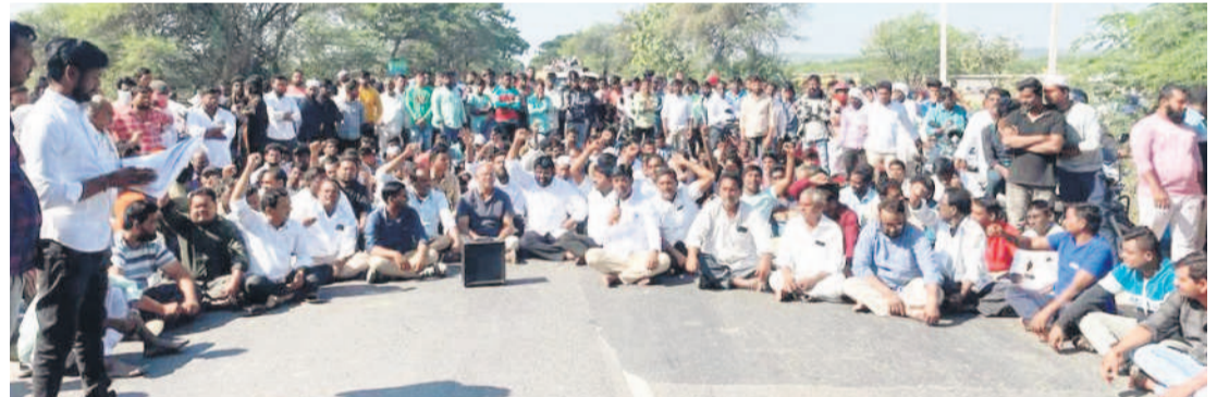
దిలావర్పూర్ వద్ద జాతీయ రహదారిపై ఇథనాల్ పరిశ్రమ నిలిపేయాలని ధర్మా చేస్తున్న రైతులు, వివిధ పార్టీల నాయకులు

దిలావర్పూర్, డిసెంబర్ 20 : నిర్మల్ జిల్లా దిలావర్పూర్, గుండంపల్లి గ్రామాల పరిధిలో నిర్మల్లోని ఇథనాల్ పరిశ్రమ పనులు ఆపకపోతే ఆత్మహత్యలు చేసుకుంటామని, మా భవ్యత తరాలకు మాత్రం నష్టం కలుగవద్దని నాయకులు, యువకులు, వివిధ పార్టీల నాయకులు ఆందోళన నిర్వహించారు. బుధవారం ఉదయం దిలావర్పూర్ వద్ద గల జాతీయ రహదారి-612 పై ఖైదాయిలను.