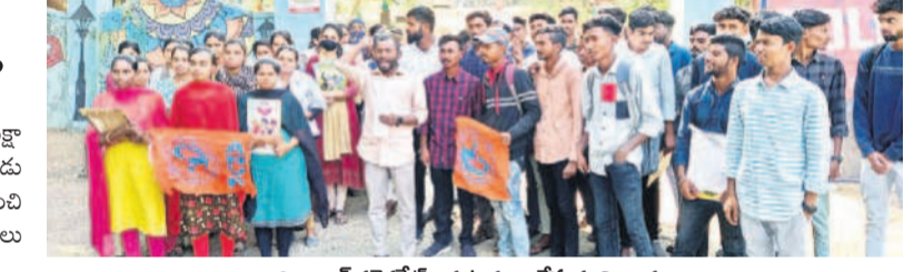
ఆదిలాబాద్ కలెక్టరేట్ ఎదుట ధర్మా చేస్తున్న విద్యార్థులు

డుతూ.. గతంలో ప్రభుత్వ జూనియర్ కళాశాలలోనే పరీక్షా కేంద్రాన్ని ఏర్పాటు చేశారన్నారు. అదేవిధంగా ఇప్పుడు కూడా కేంద్రాన్ని ఏర్పాటు చేయాలని కోరారు. బేల నుంచి ఆదిలాబాద్ కు రావాలంటే చాలా ఇబ్బందికర పరిస్థితులు ఉన్నాయని వారు తెలిపారు.