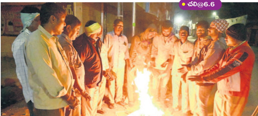
మంచిర్యాల పట్టణంలో చలి నుంచి ఉపశమనం కోసం మంట కాగుతున్న జనం

మంచిర్యాల, డిసెంబర్ 21(నమస్తే తెలంగాణ ప్రతినది) : ఉమ్మడి ఆదిలాబాద్ జిల్లా లో కొన్ని రోజులుగా చలి తీవ్రత పెరిగింది. ఉదయం, సాయంత్రం వీపున చలిగాలులు జవాన్ని ఉక్కిరిబిక్కిరి చేస్తున్నాయి. ఉదయం 9 గంటల వరకు కూడా మంచు కురుస్తుందిగా.. సాయంత్రం 7 గంటల తరువాత బయటికి వచ్చే పరిస్థితి కనిపించడం లేదు. మారిన వాతావరణంతో చాలా మంది జలుబు, దగ్గు, జ్వరంతో బాధపడుతున్నారు. ఇలాంటి పరిస్థితుల్లో కరోనా వ్యాప్తి చెందుతుందంటూ వ్యాప్తి నిపుణులు హెచ్చరిస్తున్నారు. రాష్ట్రంలో ఇప్పటి వరకు వ్యాప్తి చెందడం లేదు. ప్రస్తుతానికి భయపడే పరిస్థితి ఉంది. ఆదిలాబాద్ జిల్లాలో డిసెంబర్ నెల మొదటి వారం నుంచి చలి వణికిస్తున్నది.