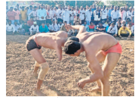
బోగింగాంలో కుస్తీ పడుతున్న మల్లయోధులు