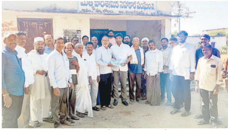
ఇథనాల్ పరిశ్రమ నిలిపివేసేందుకు లోలం గ్రామస్థుల మద్దతుకోరుతున్న యువకులు