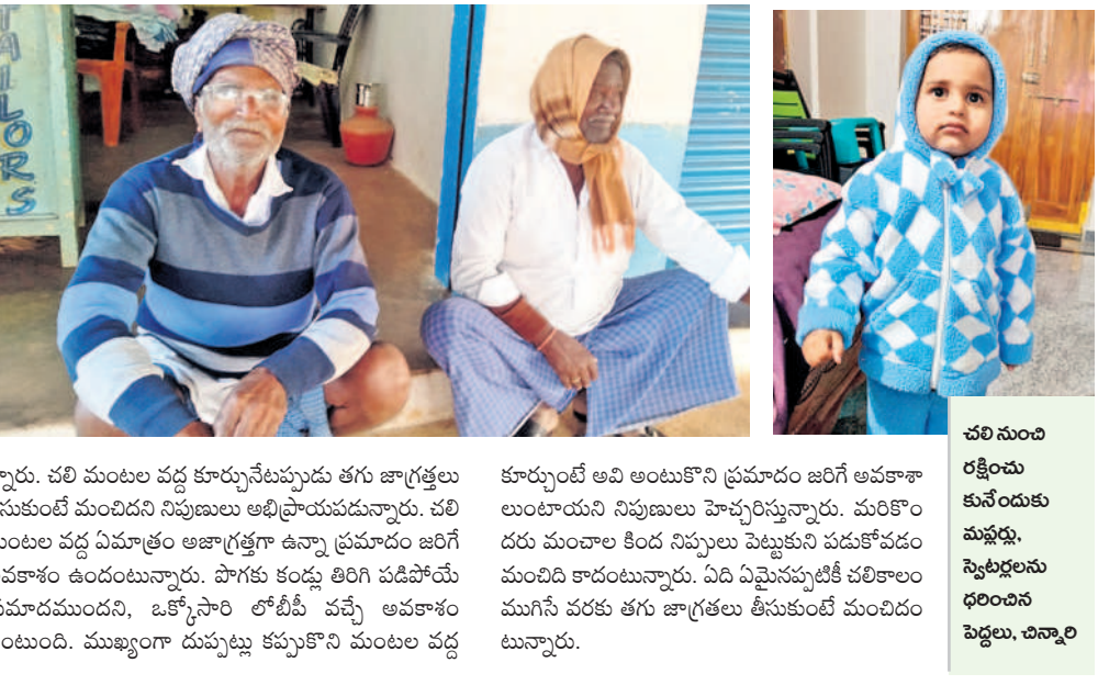
చలి సుంద కునేందుకు ముఖ్యమంత్రి స్వేచ్ఛలను ధరించిన పెద్దలు, చిన్నారు

■ గజగజలాడుతున్న వల్లెలు ■ వడిపోతున్న కనిష్ట ఉష్ణోగ్రతలు ■ బయటకు వెళ్లేందుకు జంతువున్న ప్రజలు ■ చలిమంట వద్ద జాగ్రత్తగా ఉండాలంటున్న నిపుణులు న్యూలీకల్, డిసెంబర్ 21: వాతావరణంలో చోటుచేసుకున్న మార్పులతో ఒక్కసారిగా పెరిగిన చలి తీవ్రతతో ప్రజలు గజగజ వణికిపోతున్నారు. ఎముకల కొరతే చలితో ఉడదుమే వివిధ పనుల నిమిత్తం వెళ్ల కూలిలు, కార్మికులు, రైతులు, ఉద్యోగులు జంతువున్నారు. చలి తీవ్రతతో కొందరికే తెల్లవారినా దుప్పట్లను విడవక, మంట, ఎండను ఆశ్రయిస్తున్నారు. పగటి ఉష్ణోగ్రతలు సైతం పడిపోతుండడంతో సాయంత్రం 6 గంటలకే ప్రజలు ఇంట్లోకి జారుకుంటున్నారు. చలి తీవ్రత నుంచి రక్షించుకునేందుకు ప్రజలు స్వెటర్లు, జర్సీస్, మువ్వల, మంకీ క్యాపిలు, ఉన్ని దుస్తులు, చేతులకు గ్లాస్లు, కాళ్ళకు సాక్సులను వినియోగించుకుంటున్నారు. గతేడాది కంటే అధికంగా ధరలు పెరిగిపోవడంతో చలి తీవ్రత నుంచి కాపాడుకునేందుకు తప్పని పరిస్థితుల్లో వాటిని కొనుగోలు చేయాల్సి వస్తుందని ప్రజలు అంటున్నారు. వాహనాలపై దూర ప్రాంతాలకు వెళ్లేందుకు వాహనచోదకులు సూచించడం లేదు. అత్యవసరం ఉంటేనే హెల్మెట్, జర్సీస్, గ్లాస్సులు వేసుకొని వెళ్తున్నారు. గతేడాది కంటే ఈ సారి చలి ప్రభావం ఎక్కువగా ఉండడంతో ఇంటి అవణలలో చలిమంటలు ఏర్పాటు చేసుకొని చలి తీవ్రతను తట్టుకునేందుకు నానాకంటాలు పడుతున్నారు.