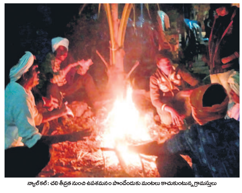
న్యూలీకల్: చలి తీవ్రత నుంచి ఉపశమనం పొందేందుకు మంటలు కాచుకుంటున్న గ్రామస్థులు