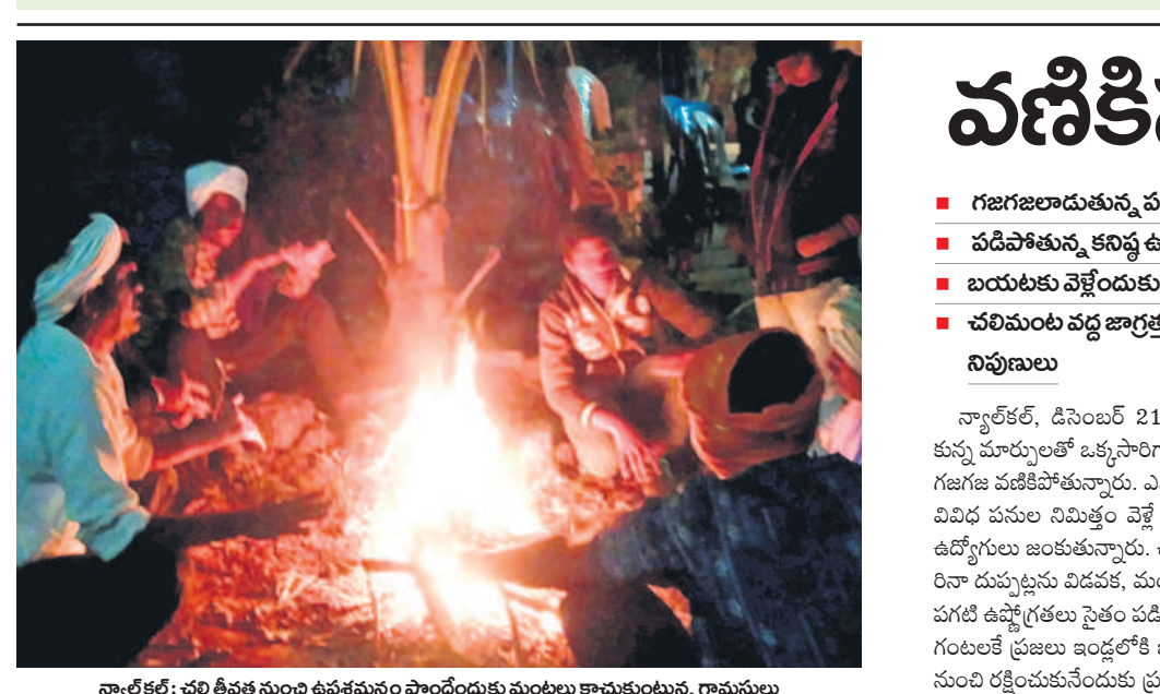
న్యూలీకల్: చలి తీవ్రత నుంచి ఉపశమనం పొందేందుకు మంటలు కాచుకుంటున్న గ్రామస్థులు