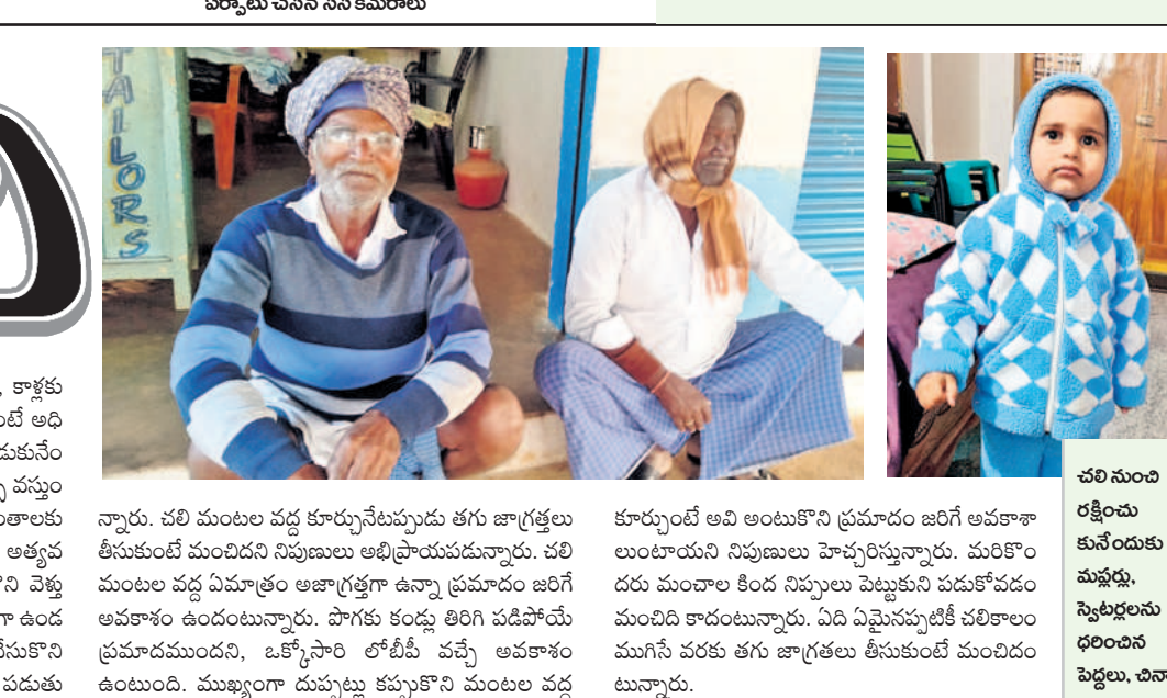
చలి నుంచి కునేందుకు ముఖ్య స్వల్పరేణు ధరించిన పిల్లలు, చిన్నారు