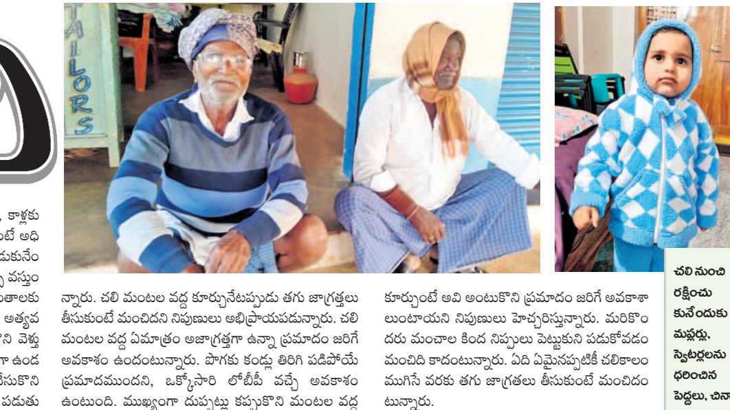
చలి నుంచి కునేందుకు ముఖ్య స్వల్పరేణు ధరించిన పిల్లలు, చిన్నారు