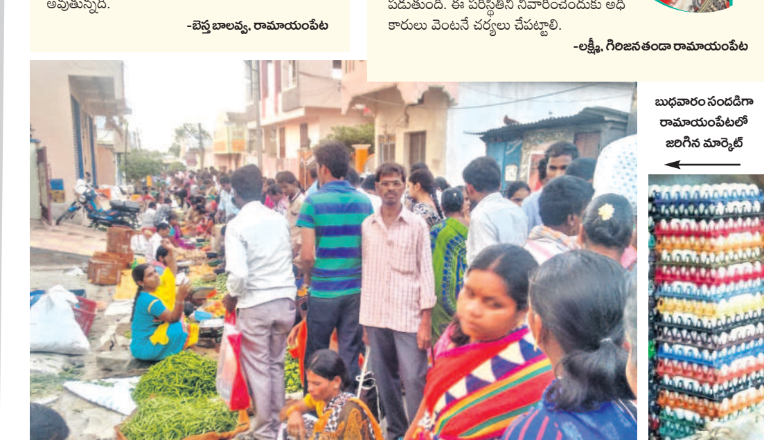
బుద్ధవారం సందడిగా రామాయంపేటలో జరిగిన మార్కెట్