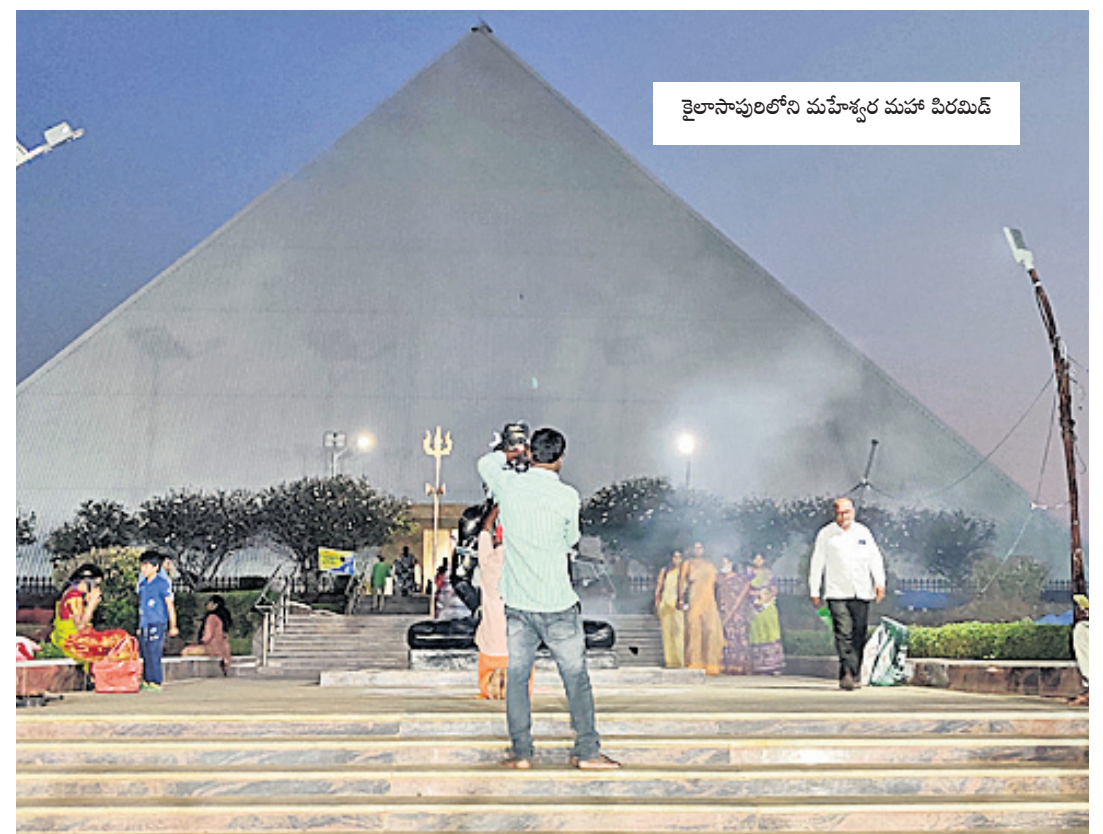
శైలానాపురిలోని మహేశ్వర మహా పిరమిడ్