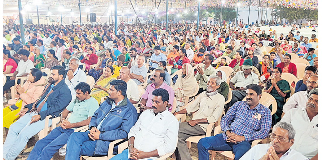
ధ్యాన మహాసభలో పాల్గొన్న ధ్యానులు, పిరమిడ్ మాస్టర్లు