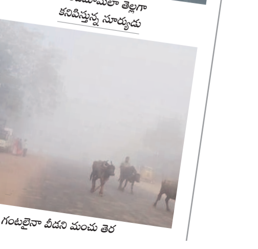
చందమామలా తెల్లగా కనిపిస్తున్న సూర్యుడు

ఓ వైపు పొగమంచు.. మరోవైపు ఎముకలు కొరికే చలితో ప్రజలు గజగజ వణకుతున్నారు. ఉదయం తొమ్మిది గంటలైనా వాహనదారులు లైట్లు వేసుకొని ప్రయాణించారు. ఈ దృశ్యాలు మంగపేట మండలం కమలాపురం, మంగపేట, బోరునర్సాపురం గ్రామాల్లో కనిపించాయి. మరోవైపు సూర్యుడు సైతం చందమామలా తెల్లగా కనిపిస్తూ చూపరులను కనువిందు చేశాడు. - మంగపేట, డిసెంబర్ 21