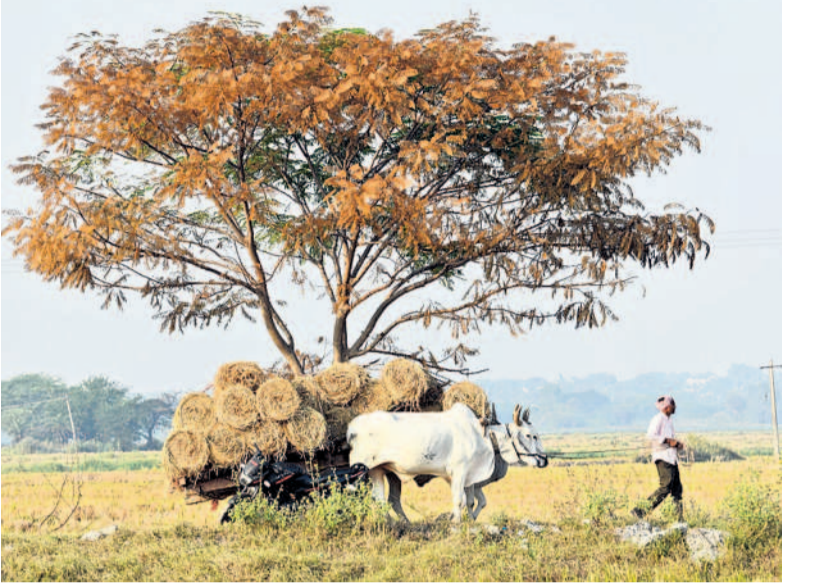
ఎడ్లబండిలో పరిగెత్తిన తీసుకెళ్తున్న రైతు