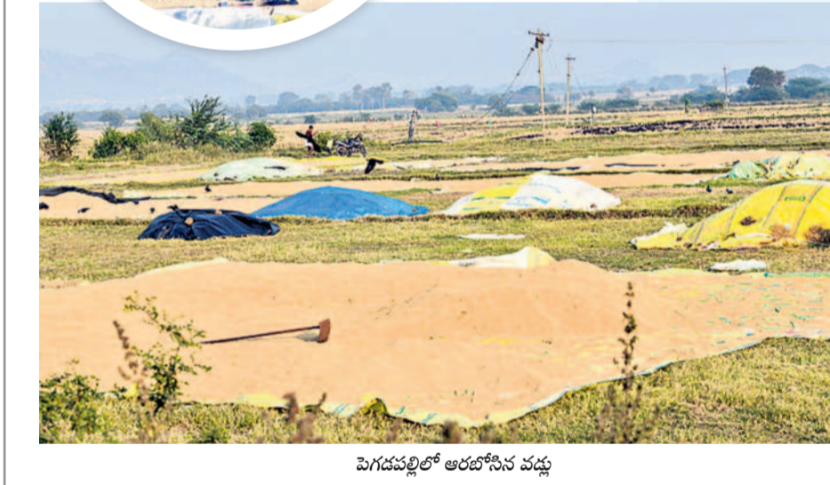
పెగడపల్లిలో ఆరబోసిన వడ్డు

కొత్తపాతల మేక వింపు పనులతో అన్నదాతలు బిజీబిజీగా ఉన్నారు. ఒకవక్కా వాన కాలం వంటి ఉత్పత్తులు ఇళ్లకు చేరుతుండగా, మరోవక్కా యానగి సాగు కోసం సన్నద్ధమవుతున్నారు. వరినాల్కు పోషకోపదంతోపాటు పొలాలకు నీళ్లు పెట్టి నానబెడుతున్నారు. వరికొయ్యలను మురిగించి కలియదున్నుతున్నారు. ట్రాక్టర్ తో దమ్ము కొడుతూ వరినాట్లకు పొలంముడులను నిడదం చేస్తున్నారు. ఇక వానకాలంకు సంబంధించి దాదాపుగా వరికొత్తలు ముగిశాయి. కొందరు రైతులు ధాన్యాన్ని కల్లాలు, రోడ్డుకు ఇరువైపులా ఆరబెట్టుకోగా, మరికొందరు బస్తాల్లో నింపుకొని సంతోషంగా తీసుకెళ్తున్నారు. పుట్ల కొట్టిపండిన వడ్ల రాశులతో పల్లెలు పునీతమవుతుండగా, ఆరుగలం శ్రమించి పండించిన పంట ఇండ్లకు చేరుతుండడంతో కర్షకులు మురిసిపోతున్నారు.