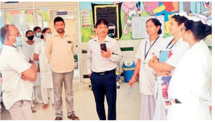
వైద్య సిబ్బందికి సూచనలు చేస్తున్న డీఎంహెచ్ఎస్ అప్పయ్య, పక్కన సూపరింటెండెంట్, సిబ్బంది