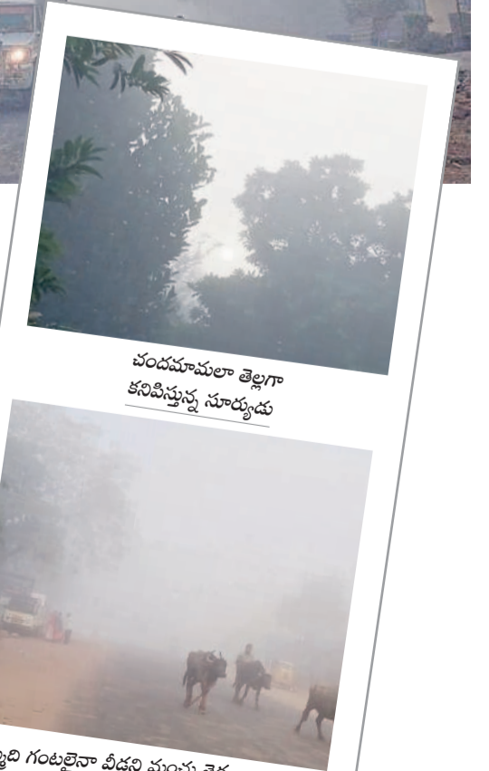
చందమామలా తెల్లగా కనిపిస్తున్న సూర్యుడు

ఓ వైపు పొగమంచు.. మరోవైపు ఎముకలు కొరికే చలితో ప్రజలు గజగజ వణకుతున్నారు. ఉదయం తొమ్మిది గంటలైనా వాహనదారులు లైట్లు వేసుకొని ప్రయాణించారు. ఈ దృశ్యాలు మంగపేట మండలం కమలాపురం, మంగపేట, బోరునర్సాపురం గ్రామాల్లో కనిపించాయి. మరోవైపు సూర్యుడు సైతం చందమామలా తెల్లగా కనిపిస్తూ చూపరులను కనువిందు చేశాడు. - మంగపేట, డిసెంబర్ 21