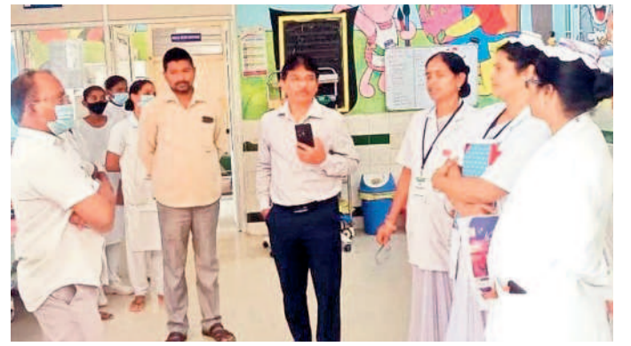
వైద్య సిబ్బందికి సూచనలు చేస్తున్న డీఎంహెచ్ఎస్ అప్పయ్య, పక్కన సూపరింటెండెంట్, సిబ్బంది

5 శుక్రవారం 22 డిసెంబర్ 2023 WARANGAL HANUMAKONDA