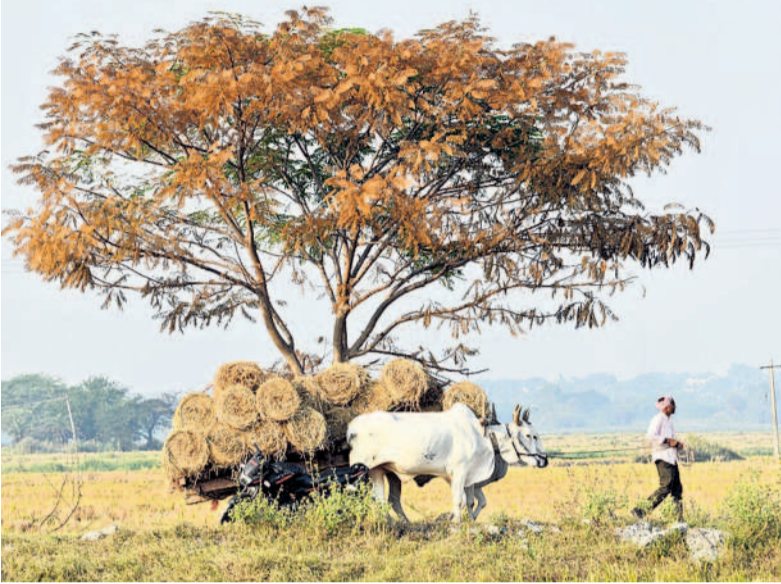
ఎడ్లబండిలో పరిగెత్తిన తీసుకెళ్తున్న రైతు