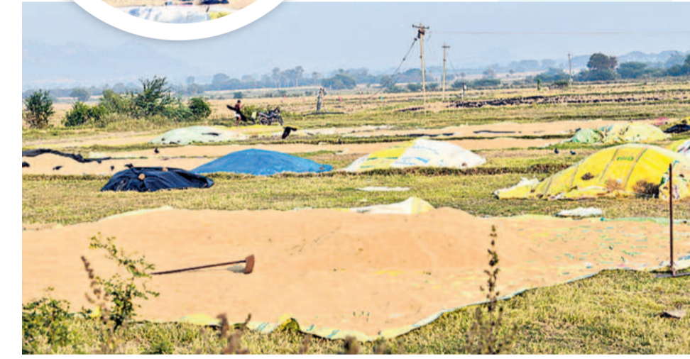
పెగడపల్లిలో ఆరబోసిన వడ్లు