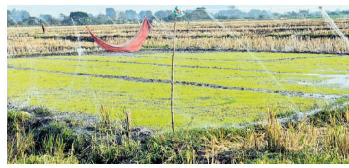
టైరాన్ పల్లి గ్రామంలో వరి నారు చుట్టు పోక కంచె