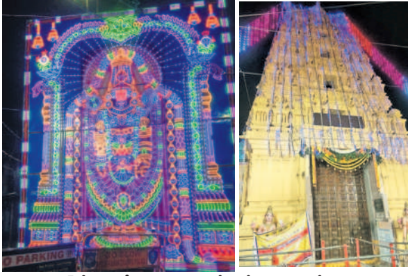
విద్యుత్ దీపాలతో అలంకరించిన వేంకటేశ్వరస్వామి దేవాలయం