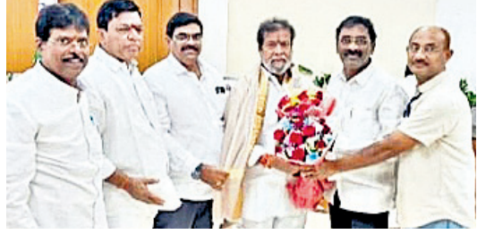
మంత్రి దామోదర రాజనరసింహను కలిసిన టీజీపీవీ ప్రతినిధులు

● వైద్య, ఆరోగ్య శాఖ మంత్రి దామోదర రాజనరసింహ