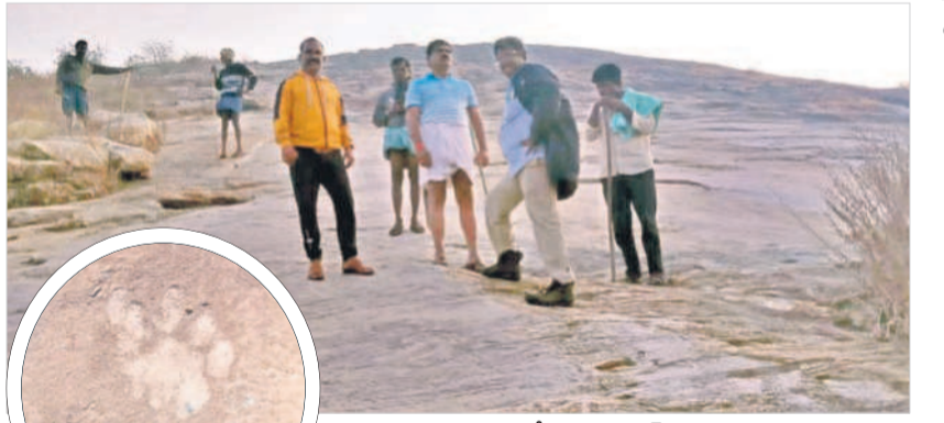
చిరుతలు ఆ నవాక్షువ రిలీఫ్ క్యాంపు నిర్వహణ కార్యక్రమం

చిరుతలు ఆ నవాక్షువ రిలీఫ్ క్యాంపు నిర్వహణ కార్యక్రమం. వందల మంది గ్రామస్థులకు తెలుపడంతో గ్రామస్థులు అక్కడికి చేరుకొని చూడగా రెండు చిరుతలు గ్రామ స్థులు చూడగానే బోడిగట్టుపైకి వెళ్లారు. వారు వెంటనే అటవీ అధికారులకు సమాచారం ఇవ్వడంతో అక్కడికి చేరుకున్న అటవీ అధికారులు గ్రామస్థులతో కలిసి చుట్టూ తేలు వేస్తే చిరుతలను పరిశీలించారు. గ్రామానికి ఆనుకొని ఉన్న బోడిగట్టుపైకి వెళ్లి చూశారు. అక్కడక్కడ చిరుత పులులు పాదముద్రలు కనిపించడంతో చాటిసే పార్టీ అధికారులు పరిశీలించారు. పశువుల కాపరులు ఒక్కొక్కరూ పశువులను మేపేయడం వల్ల కాదని, అటవీ ప్రాంతానికి వెళ్లితే ఇద్దరు లేదా ముగ్గురు వ్యక్తుల మంది దిగి అధికారులు సూచించారు. చిరుత పులులు సంవారం ఉంటే వెంటనే వైఅధికారులకు సమాచారం అందించి చాటిసే చుట్టూకున్నందుకు బోధనలు ఏర్పాటు చేస్తామని చెప్పారు. ఘటనా స్థలాన్ని పరిశీలించిన