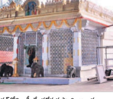
మల్లకల్లోని లక్ష్మీ వేంకటేశ్వర స్వామి ఆలయం