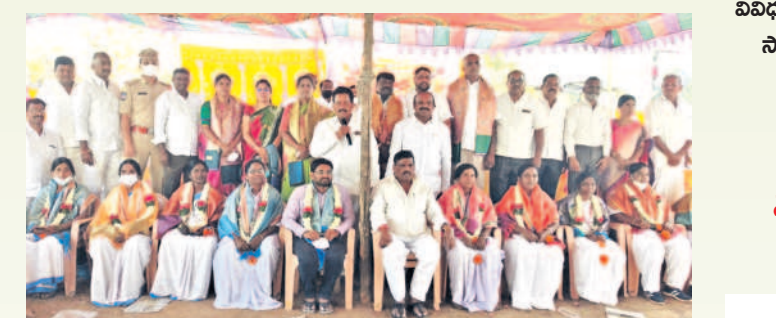
గుమ్మడిదలలో రైతు దినోత్సవం సందర్భంగా రైతులను సన్మానిస్తున్న రైతు సంఘం ప్రతినిధులు (ఫ్రోల్)

గుమ్మడిదల, డిసెంబర్ 22: దేశ మాజీ గృహ మంత్రి వరహేంద్రవర్మ ప్రధాని చౌదరి చరణ్ సింగ్ జయంతిని పురస్కరించుకుని దేశ వ్యాప్తంగా కిసాన్ దివస్ (జాతీయ రైతు దినోత్సవం)ను నిర్వహిస్తున్నారు. ఈ కార్యక్రమంలో వివిధ రకాల పంటల్లో మంచిదిగుబడి సాధిస్తున్న రైతులను సత్కరిస్తూ పునంగా నిర్వహించి, భారత లను ఉత్తమ రైతులుగా ఎంపిక చేసే వారిని రైతు సంఘం సభ్యులు పునంగా సన్మానిస్తూ రైతు సంఘం సభ్యులు, రైతులకు ఆయన చేసిన సేవలను వివరిస్తారు.