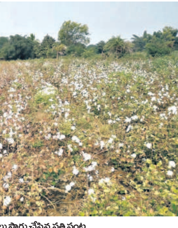
జూబిలాబాద్ మండలంలో రైతులు సాగు చేసిన పత్తి పంట

మార్కెటింగ్ లైసెన్సులు లేకుండానే బహిరంగంగా పత్తి కొనుగోళ్లు న్యూకెల్, రురాసంగం మండలాల్లో పుట్టగొడుగులా వెలిసిన పత్తి కొనుగోలు షాపులు సీసీబి ప్రకటించిన మద్దతు ధర క్రిందటాల్కు రూ.7,020 వ్యాపారులు రైతుల వద్ద రూ.6,500లకు కొనుగోలు తీవ్రంగా నష్టపోతున్న రైతులు లాభాలు గడిస్తున్న వ్యాపారులు ప్రభుత్వం అండగా నిలవాలంటున్న రైతులు