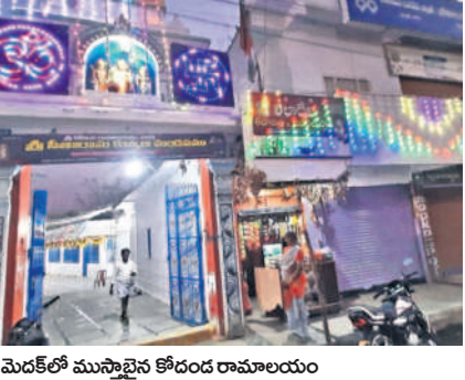
మెడకలో ముస్తాబైన కోదండ రామాలయం