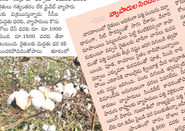
జూబిలాబాద్ మండలంలో రైతులు సాగు చేసిన పత్తి పంట

మార్కెట్ ఫీజు చెల్లించకుండానే కొనుగోలు జూబిలాబాద్ ప్రాంతంలో పత్తి వ్యాపారులు మార్కెట్ ఫీజు చెల్లించకుండానే పత్తి కొనుగోలు చేస్తున్నారు. ప్రతి గ్రామంలో వ్యాపారులు కొనుగోలు కేంద్రాలు ఏర్పాటు చేసి రైతుల నుంచి కొనుగోలు చేస్తున్నారు. వ్యాపారుల మాయాజలంతో ప్రతి ఏడాది రైతులకు రుణమే మిగులుతోంది. సీసీబి కేంద్రాలు ఏర్పాటు చేయకపోవడంతో రైతులు గత్యంతరం లేక ప్రైవేట్ వ్యాపారులకు వేసి ధరకు రూ. రూ.1000 నుంచి రూ.1500 వరకు తేడా ఉంటుంది. రైతులకు మద్దతు ధర కలిపి వింకపోవడంతోపాటు తూకంలో