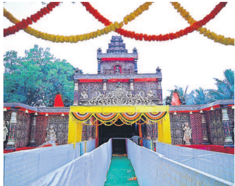
సూర్యాపేటలోని వేంకటేశ్వరస్వామి ఆలయంలో ఉత్తర ద్వార దర్శనానికి చేసిన ఏర్పాట్లు

ఆలయ వేళల్లో మార్పులు.. పలు ఆర్జిత సేవలు తాత్కాలికంగా నిలిపివేత