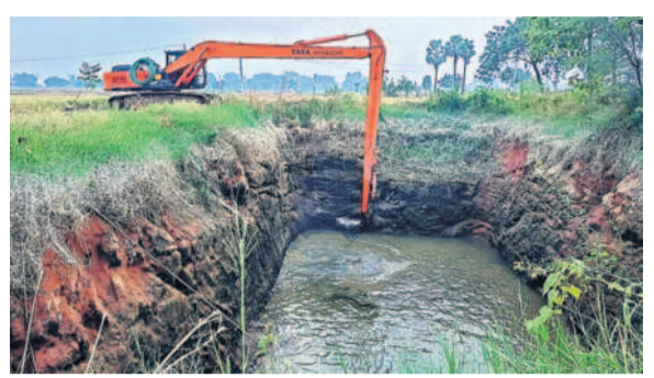
నేరేడుచర్లలో బావిలో పూడిక తీత