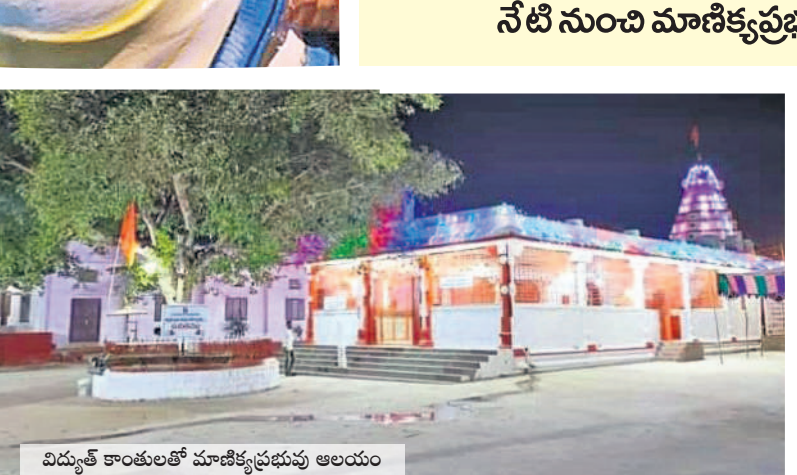
విద్వాత్ కాంతులతో మాణిక్యప్రభువు అలయం

నవాబుపేట, డిసెంబర్ 22 : చారిత్రక యుగంలో శ్రీ గురుదత్తాత్రేయము, కలియుగంలో మొట్టమొదటి శ్రీపాద వల్లభుడిగా పిఠాపురంలో నరసింహ సుస్మృతిగా, కారణంగా సుగూఢాలోనూ శ్రీ మాణిక్య ప్రభువుగా(1817-1865) మామూలుగా అవతరించాడు. మాణిక్యప్రభువు బడికిపోలేదు, ఏ చదువు చదువుకోలేదు కానీ వారు సర్వ జ్ఞానులని అవతారమూర్తులని తమ పసిప్రాణములోనే రుజువు చేశారని భక్తుల నమ్మకం. సంతానంలేనివారికి సంతానం కలిగించే బోధన, ఆపదలో ఉన్న వారి కష్టాలు తీర్చి విశ్రాంతి సందర్భం పద్ధతిలో అంతటా అవతరించి ఎందరినో కాపాడి భక్తుల పాలిట కొంగు బంగారంగా విరాజిల్లారు. మాణిక్యప్రభువు భారతదేశంలోని అన్ని పుణ్యక్షేత్రాలను సందర్శించి తమ 28వ ఏట విరజ గురుగంగా అనే చిన్న నదిలో సంగమ స్థానంలో ప్రకృతి రమణీయమైన స్థలంలో అదీల్ప వృక్షయు కింద స్థగరంగా నిలిచిపో