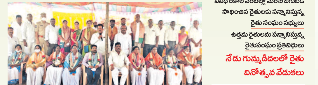
గుమ్మడిదలలో రైతు దినోత్సవం సందర్భంగా రైతులను సన్మానిస్తున్న రైతు సంఘం ప్రతినిధులు

గుమ్మడిదల, డిసెంబర్ 22: దేశ మాజీ ప్రధాని చౌదరి చరణ్ సింగ్ జయంతిని పురస్కరించుకుని దేశ వ్యాప్తంగా కిసాన్ దివస్ (జాతీయ రైతు దినోత్సవం)ను నిర్వహిస్తున్నారు. ఈ కార్యక్రమంలో వివిధ రకాల పంటల్లో మంచిదిగుబడి సాధిస్తున్న రైతులను ప్రశంసించుకుంటున్నారు. గుమ్మడిదల మండలంలో పలువురు రైతులు దేశ మాజీ ప్రధాని చౌదరి చరణ్ సింగ్ జయంతిని పురస్కరించుకుని దేశ వ్యాప్తంగా కిసాన్ దివస్ (జాతీయ రైతు దినోత్సవం)ను నిర్వహిస్తున్నారు. ఈ కార్యక్రమంలో వివిధ రకాల పంటల్లో మంచిదిగుబడి సాధిస్తున్న రైతులను ప్రశంసించుకుంటున్నారు. గుమ్మడిదల మండలంలో పలువురు రైతులు దేశ మాజీ ప్రధాని చౌదరి చరణ్ సింగ్ జయంతిని పురస్కరించుకుని దేశ వ్యాప్తంగా కిసాన్ దివస్ (జాతీయ రైతు దినోత్సవం)ను నిర్వహిస్తున్నారు. ఈ కార్యక్రమంలో వివిధ రకాల పంటల్లో మంచిదిగుబడి సాధిస్తున్న రైతులను ప్రశంసించుకుంటున్నారు.