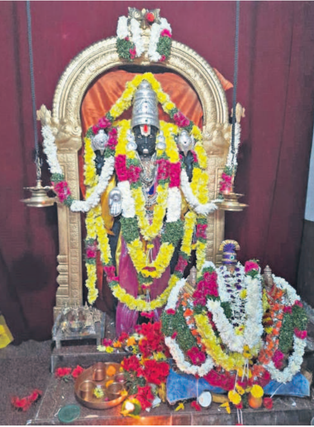
దర్శనం ఉదయం 4 గంటల నుంచే..

ఉత్తర ద్వార దర్శనం శనివారం వేకువజామునే (ఉదయం 4 గంటల నుంచి) ప్రారంభమై రోజంతా కొనసాగుతుంది. ఉదయం పది గంటలలోపు ఉత్తర ద్వార దర్శనం చేసుకోవడం మంచిదని వేద పండితులు తెలుపుతున్నారు. ఈ రోజునే విష్ణు భగవానుడిని ప్రసన్నం చేసుకునేందుకు ప్రత్యేక పూజలు, ప్రత్యేక నిర్వహించడం ఆనవాయితీగా వస్తోంది. వైకుంఠ ఏకాదశిని పురస్కరించుకుని దేవాలయాన్ని ముస్తాబయ్యారు.