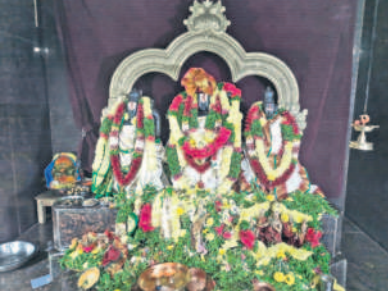
కొలుపు దీపం సీతలామల స్వామి