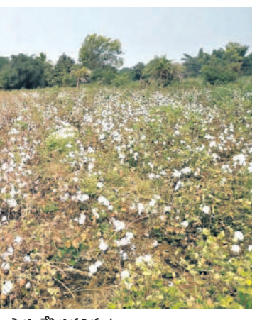
జూలూబాద్ మండలంలో రైతులు సాగు చేసిన పత్తి పంట

మార్కెటింగ్ లైసెన్స్ లు లేకుండానే బహిరంగంగా పత్తి కొనుగోళ్లు న్యూకేల్, ఝాన్సీ మండలాల్లో పుట్టగొడుగులా వెలిసిన పత్తి కొనుగోలు షాపులు సీసీబి ప్రకటించిన మద్దతు ధర క్వింటాల్ కు రూ.7,020 వ్యాపారులు రైతుల వద్ద రూ.6,500లకు కొనుగోలు తీవ్రంగా నష్టపోతున్న రైతులు లాభాలు గడిస్తున్న వ్యాపారులు ప్రభుత్వం అండగా నిలవాలంటున్న రైతులు