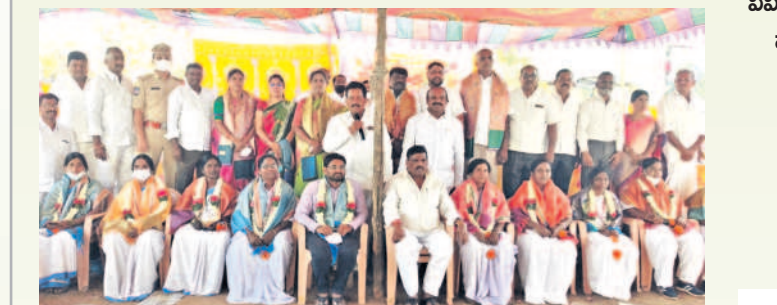
గుమ్మడిదలలో రైతు దినోత్సవం సందర్భంగా రైతులను సన్మానిస్తున్న రైతు సంఘం ప్రతినిధులు (ఫ్రోల్)

గుమ్మడిదల, డిసెంబర్ 22: దేశ మాజీ ప్రధాని చౌదరి చరణ్ సింగ్ జయంతిని పురస్కరించుకుని దేశ వ్యాప్తంగా కిసాన్ దివస్ (జాతీయ రైతు దినోత్సవం)ను నిర్వహిస్తున్నారు. ఈ కార్యక్రమంలో వివిధ రకాల పంటల్లో మంచిదిగుబడి సాధిస్తున్న రైతులను సన్మానిస్తూ ఘనంగా నిర్వహించి, భారత లను ఉత్తమ రైతులుగా ఎంపిక చేసే వారిని రైతు సంఘం సభ్యులు ఘనంగా సన్మానిస్తూ రైతు సంఘం సభ్యులు ఘనంగా సన్మానిస్తూ లను వివరిస్తారు.