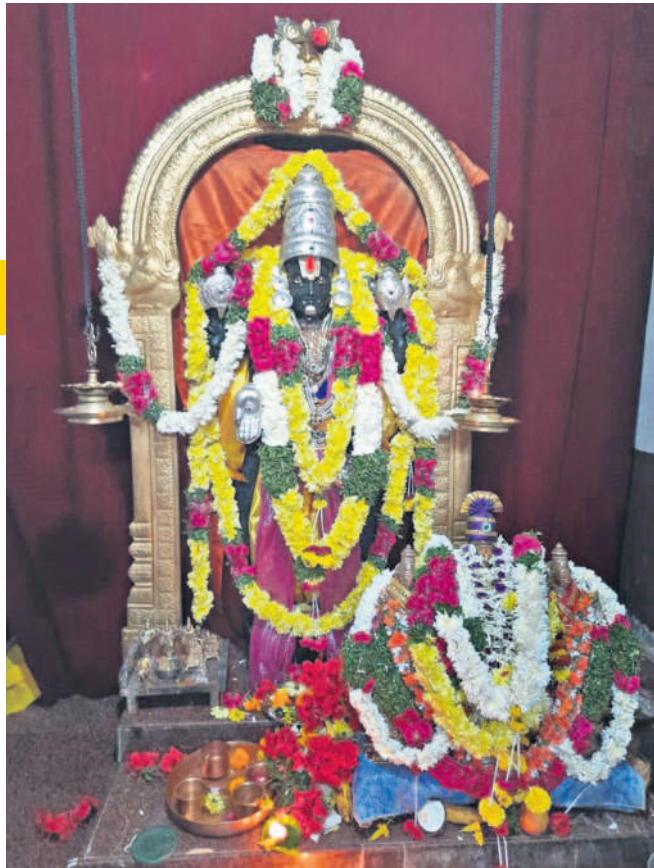
దర్శనం ఉదయం 4 గంటల నుంచే..

ఉత్తర ద్వార దర్శనం శనివారం వేకువజామునే (ఉదయం 4 గంటల నుంచి) ప్రారంభమై రోజంతా కొనసాగుతుంది. ఉదయం పది గంటలలోపు ఉత్తర ద్వార దర్శనం చేసుకోవడం మంచిదని వేద పండితులు తెలుపుతున్నారు. ఈ రోజున విష్ణు భగవాణుడిని ప్రసన్నం చేసుకునేందుకు ప్రత్యేక పూజలు, ప్రత్యేక నిర్వహించడం ఆనవాయితీగా వస్తోంది. వైకుంఠ ఏకాదశిని పురస్కరించుకుని దేవాలయాల్ని ముస్తాబయ్యారు.