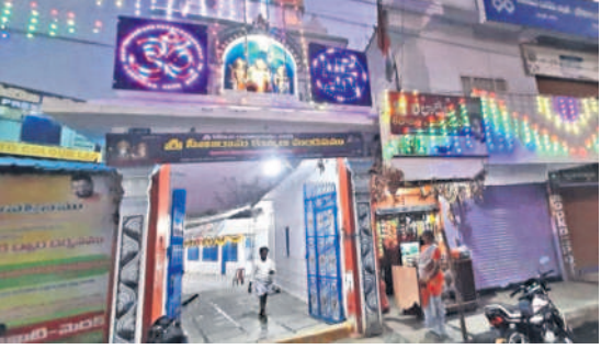
మేడకలో ముస్తాబైన కోదండ రామాలయం

పాలసంధ్రాన్ని దేవదానవులు బిలకా ముక్కోటి ఏకాదశి రోజునే హోదాపాలం, అమృతం కూడా ఉద్యవించాయని పురాణాల్లో పేర్కొన్నారు. ఈ హోదాపాలాన్ని దేవతల కోరిక మేరకు పరమశివుడు మింగి గరుత్మంతుడిగా పేరు పొందాడు. సంద్రం నుంచి లభించిన అమృతాన్ని విష్ణుమూర్తి దేవతలకు పంపాడని, ఇదే రోజునే జగద్గురువు శ్రీకృష్ణ పరమాత్మ భగవద్దీక్షను అర్చన సుడికి ఉపదేశించాడని ప్రతీతి. విష్ణువు రాజం ప్రకారం ఇద్దరు అనురుల ఆభరణ