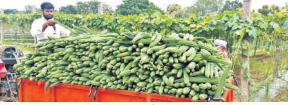
బీరకాయలను మార్కెట్ కు తరలిస్తున్న కూలీలు