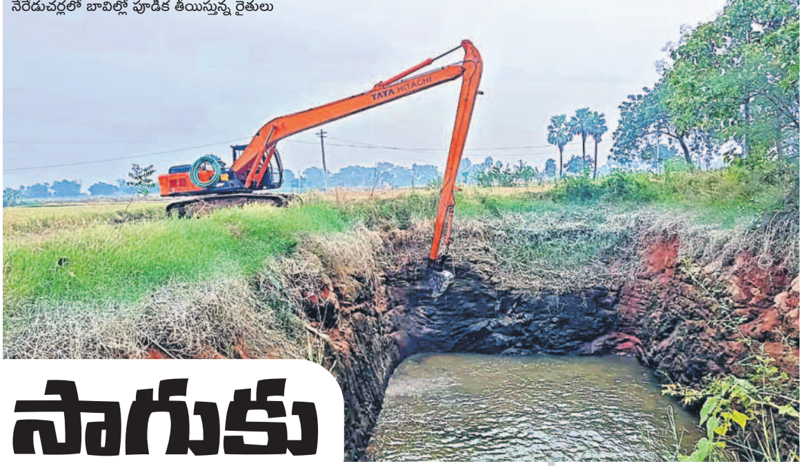
నేరేడుచర్లలో బావిల్లో పూడిక తీయిస్తున్న రైతులు

పాలకవీడు, డిసెంబర్ 22 : కేసీఆర్ హయాంలో వరుసగా 18 సార్లు సాగర్ ఆయకట్టుకు నీరు వదలడంతో రైతులు ఏ ఇబ్బంది లేకుండా వ్యవసాయం పండగలా చేసుకొన్నారు. గత వానకాలం ప్రారంభంలో నీటి విడుదల జరుగకున్నా నాటి నమ్మకంతో రైతులు వరిసాగు చేపట్టారు. తీరా ఎండిపోయి పరిస్థితి వచ్చేనాటికి ప్రభుత్వం నీటిని విడుదల చేయడంతో వేలాది ఎకరాలలో పంట చేతికి వచ్చింది. దీనికి తోడు ధాన్యానికి వానకాలంలో సన్న రకానికి చెందిన వరి ధాన్యానికి క్వింటాల్కు రూ.2,600 నుంచి రూ.3,200 ధర పలికింది. ఈ నేపథ్యంలో ఈ యాసంగి సాగు చేసేందుకు తమకున్న పంట పొలాల్లో నీటి లభ్యతను పెంచుకోవడం కోసం రైతులు విరివిగా బోర్లు వేయించుకొంటున్నారు. దీంతో పలు గ్రామాల్లో బోరు బండ్లు విరివిగా కనిపిస్తున్నాయి.