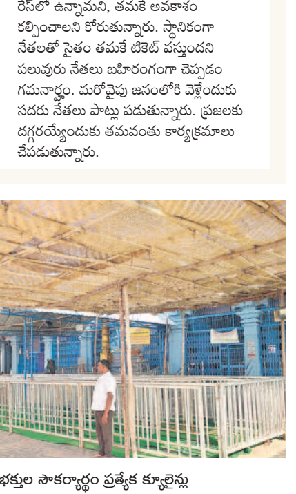
మరంపల్లి : మట్లపల్లిలో భక్తుల సౌకర్యార్థం ప్రత్యేక కూర్చోబెట్టే

మెప్పుకోసం నేతల ప్రయత్నాలు.. ఎన్నికల సమయం దగ్గర పడుతుండడంతో ప్రజల్లోకి వెళ్లేందుకు నేతలు నానాశంకాలు పడుతున్నారు. అటు పార్టీల అధిష్టానం మెప్పుకోసం నేతలకు అవకాశాలు సాగుతున్నాయి. ప్రజలకు పలువురు మాజీ ఎమ్మెల్యేలు, సీనియర్ నేతలు పోటీకి ఆసక్తి చూపుతున్నారు. తాము టీజేపీ