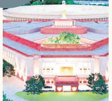
అటు లభికారులు.. ఇటు పార్టీల ప్రజాళిక వచ్చే వారం నుంచి వివిధ ఎన్నికల కమిటీల నియామకం గెలుపు కోసం రాజకీయ పార్టీల ఫోకస్ బలలో నిలిచేందుకు పలువురు నేతల ఆసక్తి అధిష్టానం మెప్పుకోసం ప్రయత్నాలు

అటు లభికారులు.. ఇటు పార్టీల ప్రజాళిక వచ్చే వారం నుంచి వివిధ ఎన్నికల కమిటీల నియామకం గెలుపు కోసం రాజకీయ పార్టీల ఫోకస్ బలలో నిలిచేందుకు పలువురు నేతల ఆసక్తి అధిష్టానం మెప్పుకోసం ప్రయత్నాలు ఓటరు నమోదు షురూ.. అసెంబ్లీ ఎన్నికల సందర్భంగా కొత్త ఓటర్ల నమోదుతోపాటు మార్పులు, చేర్పులకు ఎన్నికల సంఘం అవకాశం కల్పించింది. తుది జాబితా కూడా విడుదల చేసింది. ఇప్పుడు మళ్ళీ పార్లమెంట్ ఎన్నికల నేపథ్యంలో మరో సారి కొత్త ఓటర్ ప్రక్రియకు మరో చాన్స్ ఇచ్చింది. ఈ మేరకు ఇటీవల షెడ్యూల్ కూడా విడుదల చేసింది. ఈ నెల 20 నుంచి ఓటరు నమోదు ప్రక్రియ ప్రారంభమైంది. 2024 జనవరి 1 నాటికి 18 ఏండ్లు నిండిన వారు ఓటరుగా నమోదు చేసుకోవచ్చు. జనవరి 5వ వరకు కొత్త దరఖాస్తులు స్వీకరణ, మార్పులు, చేర్పులకు అవకాశం ఉంది. జనవరి 6వ ఓటరు ముసాయిదా జారీతా, 8వ తుది జాబితాను ప్రకటించనున్నారు.