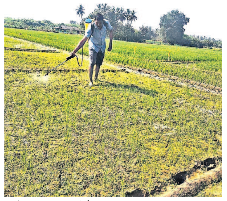
వరిలో కలుపు మందును పిచికారీ చేస్తున్న రైతు

రకాన్నిబట్టి మందును తగు సమయంలో సరైన మోతాదులో వాడాలి పిచికారీ చేయాలి కలుపు అదుపుతోనే వరిలో ఆశించిన దిగుబడులు