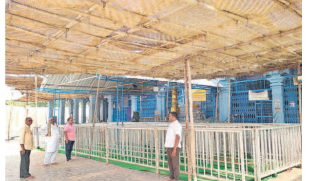
మరంపల్లి : మట్లపల్లిలో భక్తుల సౌకర్యార్థం ప్రత్యేక కూర్చోబెట్టే