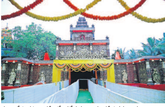
సూర్యాపేట పట్టణంలోని వేంకటేశ్వర ఆలయంలో ఉత్తర ద్వార దర్శనానికి చేసిన ఏర్పాట్లు

రేస్లో ఉన్నామని, తమకే అవకాశం కల్పించాలని కోరుతున్నారు. స్థానికంగా నేతలతో సైతం ఎంపీ సీటును కైవసం చేసుకోవాలని పలువురు నేతలు బహిరంగంగా చెప్పడం గమనార్హం. మరోవైపు జనంలోకి వెళ్లేందుకు సదరు నేతలు పాట్లు పడుతున్నారు. ప్రజలకు దగ్గరయ్యేందుకు తమవంతు కార్యక్రమాలు చేపడుతున్నారు.