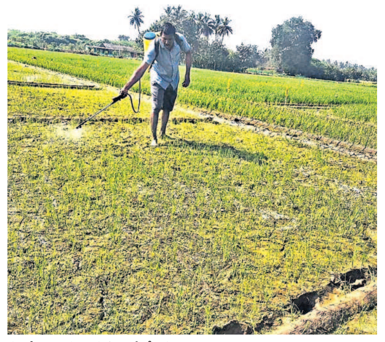
వరిలో కలుపు మందును పిచికారీ చేస్తున్న రైతు

రకాన్నిబట్టి మందును తగు సమయంలో సరైన మోతాదులో వాడాలి పిచికారీ చేయాలి కలుపు అదుపుతోనే వరిలో ఆశించిన దిగుబడులు