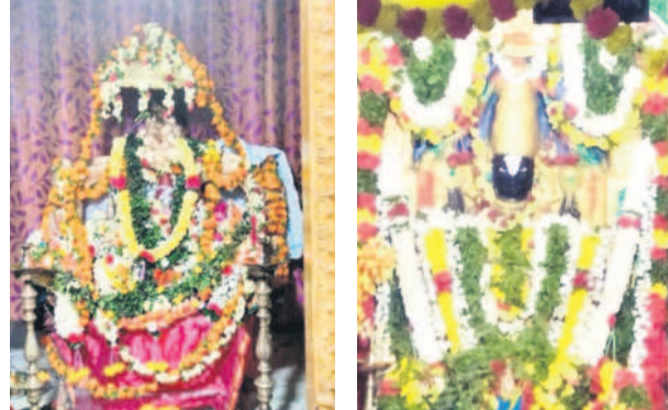
జూలూరుపాడు: పడమట నర్సంబోపురంలో: చంచుపల్లిలో..