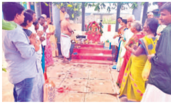
చంద్రగిరి: వెణుగోపాల స్వామి ఆలయంలో..