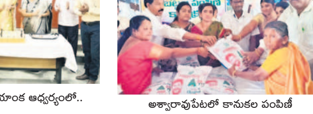
అశ్వారావుపేటలో కానుక పంపిణీ