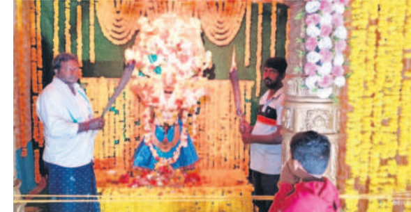
అన్నపూర్ణేశ్వరి: ఉత్తర ద్వారంలో స్వామివారి దర్శనం