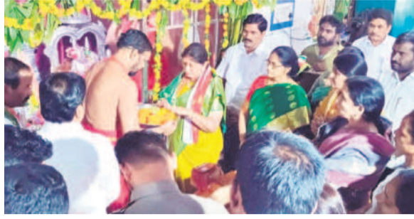
పాల్వంచ రూరల్: పూజాల్లో డివ్యూటీ సీఎం భక్తి శ్రద్ధలతో నందిని

ముక్కోటి ఏకాదశి సందర్భంగా శనివారం జిల్లాలోని ఆలయాలు ఆధ్యాత్మిక శోభను సంతరించుకున్నాయి. భక్తిపారవశ్యంతో భక్తులు తమ ఇష్ట దైవాన్ని దర్శించుకున్నారు. వైష్ణవాలయాల్లో స్వామి వారు ఉత్తర ద్వారం ద్వారా భక్తులకు దర్శనమిచ్చారు. ఆలయ కమిటీ సభ్యులు, అర్చకులు ఏర్పాట్లను పర్యవేక్షించారు. - నమస్క నడివేళ్ళ