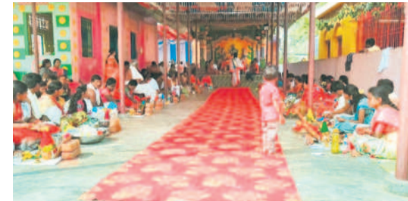
అశ్వారావుపేట రూరల్: సత్యనారాయణస్వామి వ్రతంలో భక్తులు