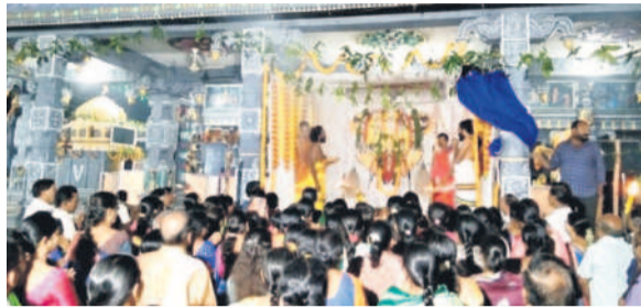
పాల్వంచ: శ్రీరామాలయ భజన మందిరంలో

ముక్కోటి ఏకాదశి సందర్భంగా శనివారం జిల్లాలోని ఆలయాలు ఆధ్యాత్మిక శోభను సంతరించుకున్నాయి. భక్తిపారవశ్యంతో భక్తులు తమ ఇష్ట దైవాన్ని దర్శించుకున్నారు. వైష్ణవాలయాల్లో స్వామి వారు ఉత్తర ద్వారం ద్వారా భక్తులకు దర్శనమిచ్చారు. ఆలయ కమిటీ సభ్యులు, అర్చకులు ఏర్పాట్లను పర్యవేక్షించారు. - నమస్క నడివేళ్ళ