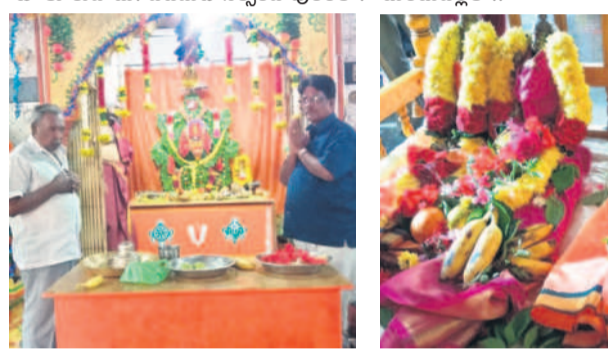
అశ్వారావుపేట టౌన్లో.. దుమ్ముగూడెంలో..