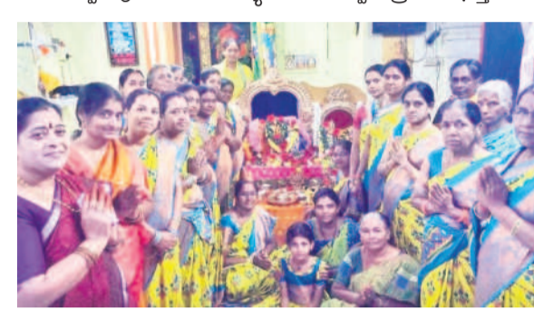
దుమ్ముగూడెం: దాసాంజనేయస్వామి ఆలయంలో