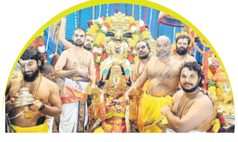
భద్రాచలం ఆలయంపై పూజలు చేస్తున్న భక్తులు

5 ఖమ్మం, ఆదివారం 24 డిసెంబర్ 2023 KHAMMAM