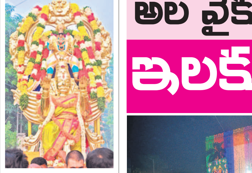
భద్రాచలం ఆలయంపై పూజలు చేస్తున్న భక్తులు