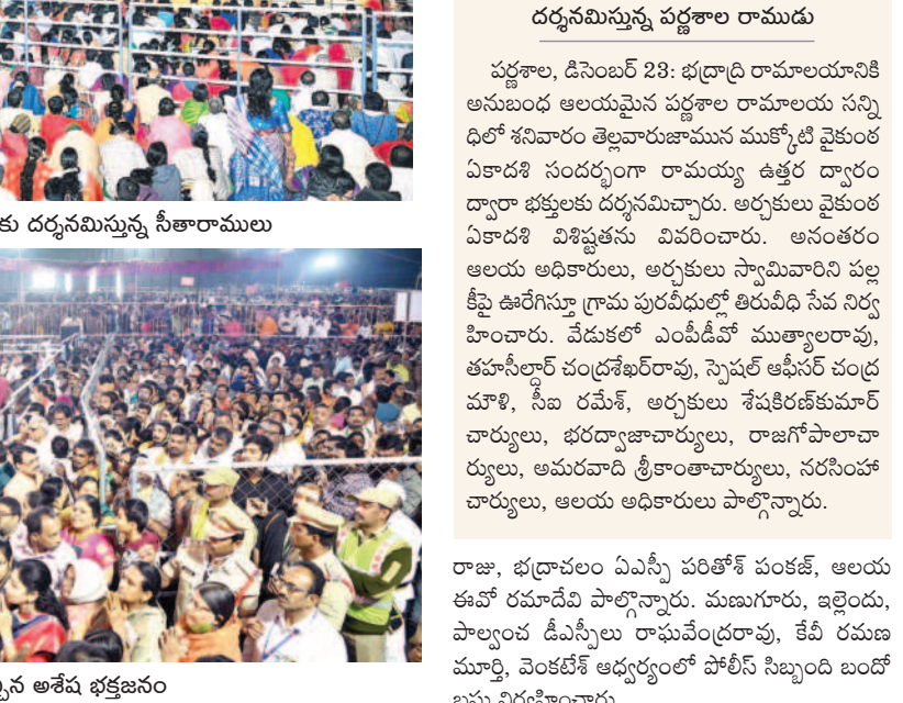
అల వైకుంఠము ఆలకు బిగి వచ్చె!

• భద్రాచలం ముక్కోటి ఏకాదశి శోభ • ఉత్తర ద్వారం ద్వారా దర్శనమిచ్చిన రామయ్య