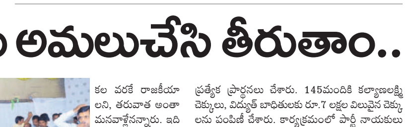
తిరుమలేశుడిని దర్శించుకున్న పార్లమెంటు సభ్యులు