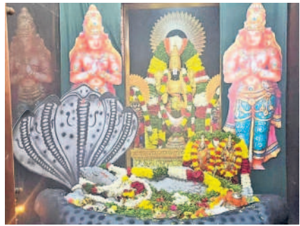
గజ్వేల్ : వేంకటేశ్వర ఆలయంలో కొలువుదీరిన స్వామివారు