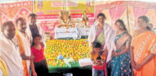
మర్రూక్ : ముక్కోటి ఏకాదశి పూజల్లో పాల్గొన్న భక్తులు