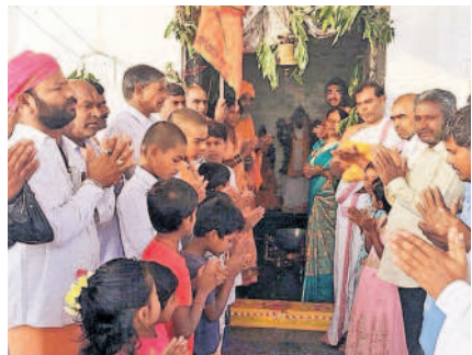
మద్దూరు : గారిళ్లూపూర్ వేంకటేశ్వరస్వామి ఆలయంలో పూజలు చేస్తున్న భక్తులు