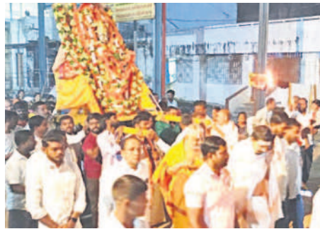
వర్ధల్ : నాచగిరిక్షేత్ర పురవీధుల్లో ఊరేగుతున్న లక్ష్మీనరసింహస్వామి వారు