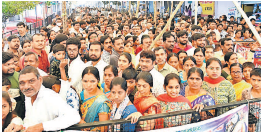
సిద్దిపేట టౌన్ : ఉత్తర ద్వార దర్శనానికి పోటీత్తిన భక్తజనం