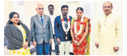
విడిపోయిన దంపతులను కలిపిన న్యాయమూర్తి