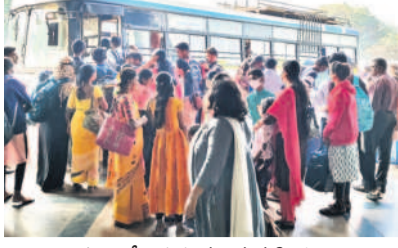
బస్సు ఎక్కేందుకు వచ్చిన మహిళలు

తెలంగాణవోక్, డిసెంబర్ 23 : ఆర్టీసీ బస్సుల్లో మహిళలకు ఉచిత ప్రయాణం ప్రారంభించినప్పటి నుంచి నిత్యం బస్సుల్లో రద్దీ కనబడుతోంది. కరీంనగర్ రీజియన్ పరిధిలో 459 పల్లెవెలుగు, 207 ఎక్స్ ప్రెస్ బస్సుల్లో గతంలో ప్రతి రోజూ 2.50 లక్షల మంది ప్రయాణించేవారు. కానీ, ఈ పథకం ప్రారంభమైన ఈ నెల 9 నుంచి ప్రతి రోజూ 4 లక్షల మంది ప్రయాణిస్తున్నారు. ఉచిత ప్రయాణంతో ప్రయాణికుల సంఖ్య 50 శాతం పెరిగింది. ఇందులో మహిళలే అధికంగా ఉంటున్నారు. అయితే, సరిపడా బస్సులు లేక పోవడంతో అదనంగా ట్రైపులు నడిస్తున్నారు. రీజియన్ పరిధిలో 1198 మంది డ్రైవర్లు, 1447 కండక్టర్లు ఉండగా, వీరికి అదనంగా విద్యులను కేటాయిస్తున్నారు.