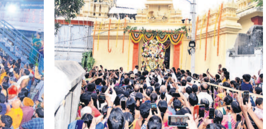
వైకుంఠ ద్వార దర్శనం.. భక్తజనం పునీతం

వేములవాడ టోన్/ధర్మపురి, డిసెంబర్ 23: ముక్కోటి ఏకాదశి వేడుకలు శనివారం ఉమ్మడి కరీంనగర్ జిల్లా వ్యాప్తంగా జరిగాయి. ప్రముఖ క్షేత్రాలైన వేములవాడ రాజన్న ఆలయం, ధర్మపురి లక్ష్మీనృసింహస్వామి, ఇల్లంపట్లకు సీతారామచంద్రస్వామి ఆలయాల్లో భిక్షులతో కీర్తనలు పోయాయి. వీటితో పాటు ఉత్తర ద్వారాలను పూలు, విద్యుత్ లైట్లతో అందంగా