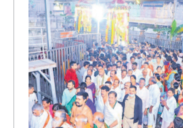
వేములవాడ టోన్: ఉత్తరమూర్ఖలతో ఆలయంలో ప్రవేశం చేస్తున్న భిక్షులు

వేములవాడ టోన్/ధర్మపురి, డిసెంబర్ 23: ముక్కోటి ఏకాదశి వేడుకలు శనివారం ఉమ్మడి కరీంనగర్ జిల్లా వ్యాప్తంగా జరిగాయి. ప్రముఖ క్షేత్రాలైన వేములవాడ రాజన్న ఆలయం, ధర్మపురి లక్ష్మీనృసింహస్వామి, ఇల్లంపట్లకు సీతారామచంద్రస్వామి ఆలయాల్లో భిక్షులతో కీర్తనలు పోయాయి. వీటితో పాటు ఉత్తర ద్వారాలను పూలు, విద్యుత్ లైట్లతో అందంగా