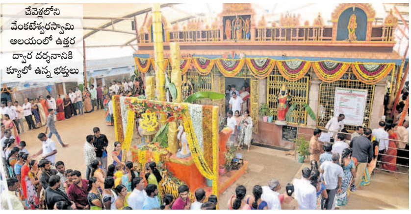
చేవెళ్లలోని వేంకటేశ్వరస్వామి ఆలయంలో ఉత్తర ద్వార దర్శనానికి క్యూలో ఉన్న భక్తులు