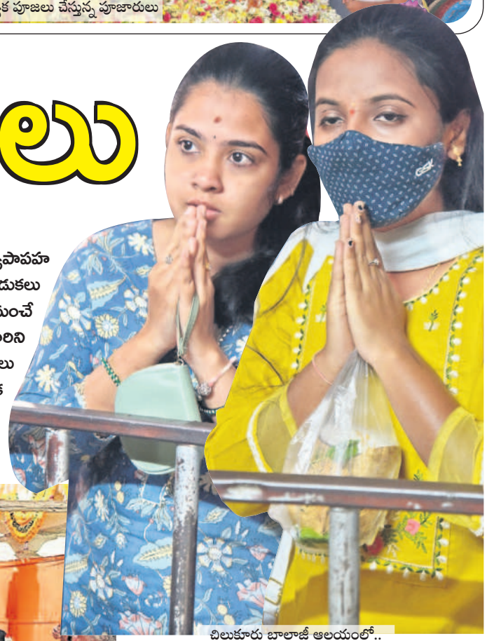
చిలుకూరు బాలాజీ ఆలయంలో..