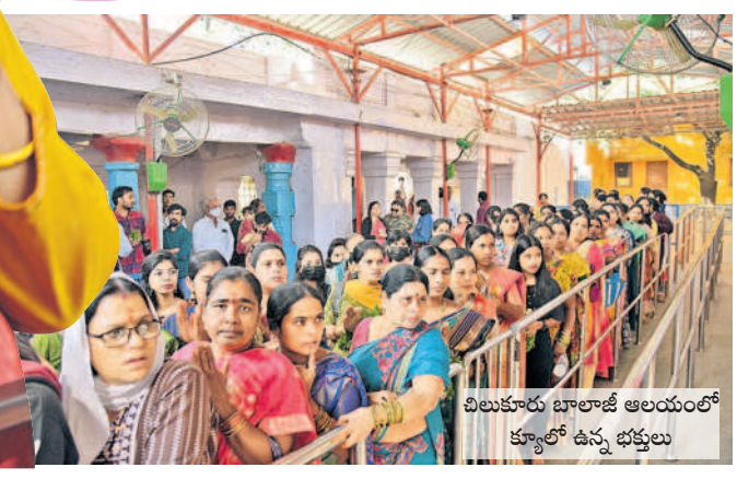
చిలుకూరు బాలాజీ ఆలయంలో క్యూలో ఉన్న భక్తులు