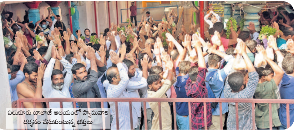
చిలుకూరు బాలాజీ ఆలయంలో స్వామివారి దర్శనం చేసుకుంటున్న భక్తులు