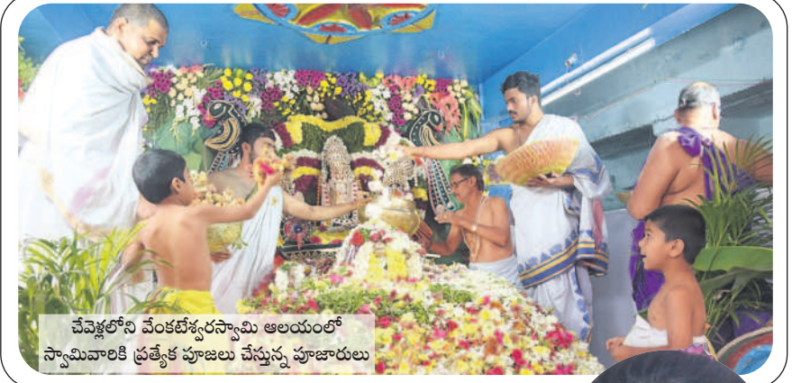
చేవెళ్లలోని వేంకటేశ్వరస్వామి ఆలయంలో స్వామివారికి ప్రత్యేక పూజలు చేస్తున్న పూజారులు