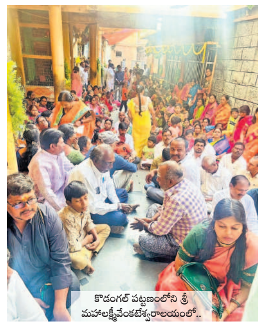
కొడంగల్ పట్టణంలోని శ్రీ మహాలక్ష్మీవేంకటేశ్వరాలయంలో..