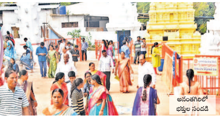
అనంతగిరిలో భక్తుల సందడి