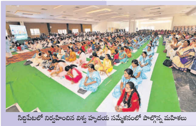
సిద్దిపేటలో నిర్వహించిన విశ్వ హృదయ సమ్మేళనంలో పాల్గొన్న మహిళలు