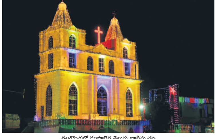
నల్లగొండలో ముస్తాబైన తెలుగు బాప్టిస్టు చర్చి

క్రైస్తవులకు పవిత్రమైన పండుగ క్రీస్మస్. ఈ వేడుక వస్తుండంతే చాలా వారం రోజుల ముందు నేడంతే సందడి సెలవులుంటుంది. ఇప్పటికే క్రైస్తవులు తమ ఇంట్లకు స్ట్రీట్ లైట్లను వెలిగించారు. ఏనుకీస్టు జనన వేదికలైన సాంతాకు బిర్లా, ట్విన్ క్రీస్టాను ఉపయోగించే వస్తువుల కొనుగోళ్లలో నిమగ్నమయ్యారు. ఉమ్మడి జిల్లా వ్యాప్తంగా ప్రధాన చర్చిలను విద్యుద్దీపాలతో అలంకరించారు. కాగా, ముందుగా పలుచోట్ల మిసీ క్రీస్టాను సలబులను ఘనంగా నిర్వహిస్తున్నారు.