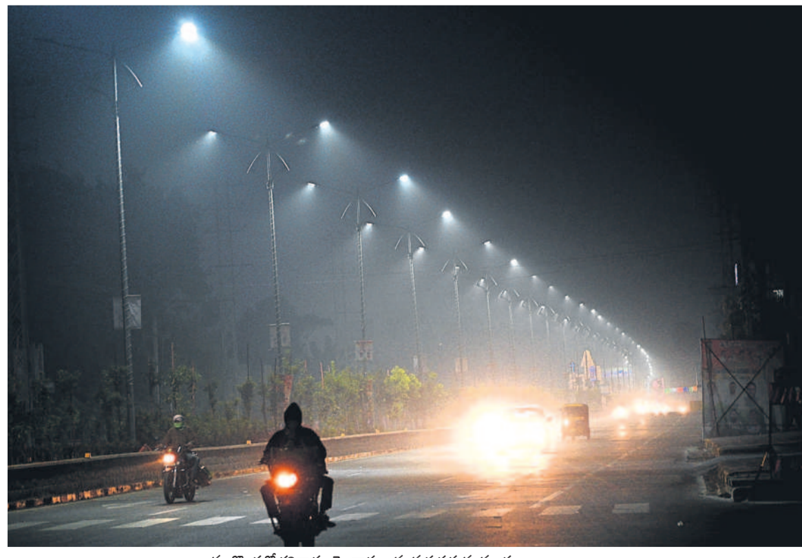
నల్లగొండలో శనివారం తెల్లవారుజామున కురుస్తున్న మంచు