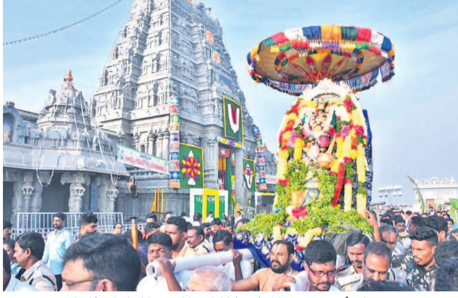
వైకుంఠ ఏకాదశి సందర్భంగా ఉత్తర ద్వారం దర్శనం అనంతరం స్వామివారి ఊరేగింపు

భక్తి శ్రద్ధలతో వైకుంఠ ఏకాదశి | ఉత్తర ద్వారంలో దర్శనమిచ్చిన లక్ష్మీనరసింహుడు కిక్కిరిసిన యాదగిరిగుట్ట అలయం | అధ్యయనోత్సవాలకు శ్రీకారం