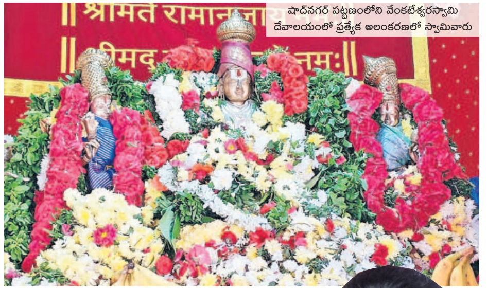
షాద్ నగర్ పట్టణంలోని వేంకటేశ్వరస్వామి దేవాలయంలో ప్రత్యేక అలంకరణలో స్వామివారు