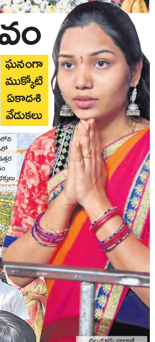
చిలుకూరు బాలాజీ ఆలయంలో స్వామివారికి నమస్కరిస్తున్న భక్తురాలు