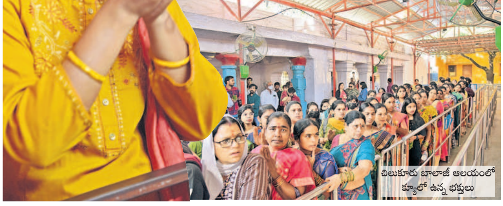
చిలుకూరు బాలాజీ ఆలయంలో క్యూలో ఉన్న భక్తులు