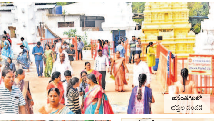
అనంతగిరిలో భక్తుల సందడి