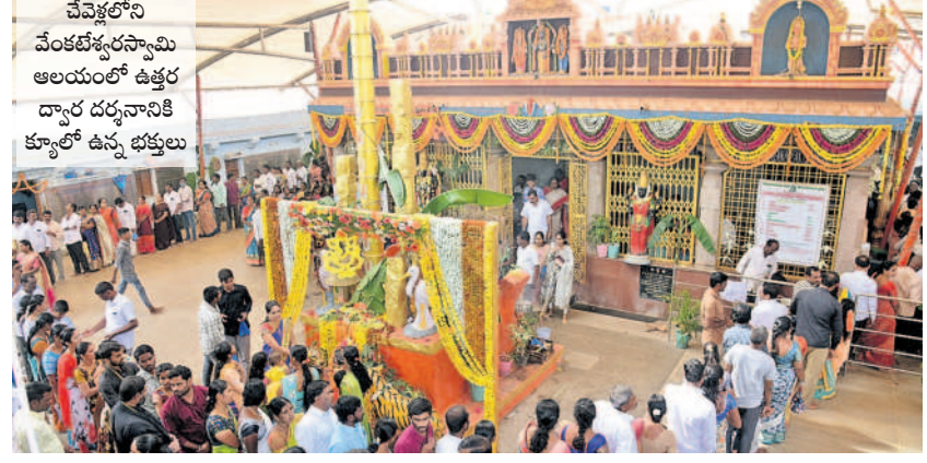
చేవెళ్లలోని వేంకటేశ్వరస్వామి ఆలయంలో ఉత్తర ద్వార దర్శనానికి క్యూలో ఉన్న భక్తులు