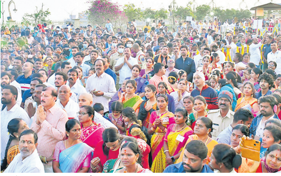
గుట్టలో వైకుంఠనాథుడిని దర్శించుకునేందుకు తరలివచ్చిన భక్తజనం

వైకుంఠ ఏకాదశి సందర్భంగా భక్తులు లక్ష్మీనరసింహస్వామిని దర్శించుకుని తృప్తయిలయ్యారు. యాదగిరిగుట్ట ఆలయ చరిత్రలో రెండోసారి వైకుంఠ ఏకాదశి ఉత్సవాలు అత్యంత వైభవోపేతంగా జరిగాయి. భక్తులు జై నారసింహ, జై జై నారసింహ అంటూ స్మరించుకున్నారు. ఆలయ పరిసరాలు భక్తజనంతో కిక్కిరిశాయి. వేకువజామునే చలిని సైతం లెక్కచేయకుండా భక్తులు వేడుకల్లో పాల్గొని మొక్కులు చెల్లించుకున్నారు. ఉత్తర ద్వారం గుండా భక్తులకు దర్శనం కల్పించిన అనంతరం వైకుంఠనాథుడిని గరుడ వాహనంపై తిరుమాఢవీధుల్లో ఊరేగింపు చేశారు. అనంతరం ఆలయంలోకి ప్రవేశింపజేసి వెలుపలి ప్రాకార మండపంలో వేంచేపు సేవకు ముగింపు పలికారు. సాయంత్రం 4 గంటల వరకు భక్తులకు ఉత్తర ద్వారం గుండా లోపలికి అనుమతించి స్వామివారి దర్శనం కల్పించారు. అలాగే జిల్లాలోని పలు ఆలయాలలో ముక్కోటి ఏకాదశి వేడుకలు జరిగాయి. ప్రజాప్రతినిధులు, అధికారులు, ప్రజలు వేడుకల్లో పాల్గొని పూజలు చేశారు.