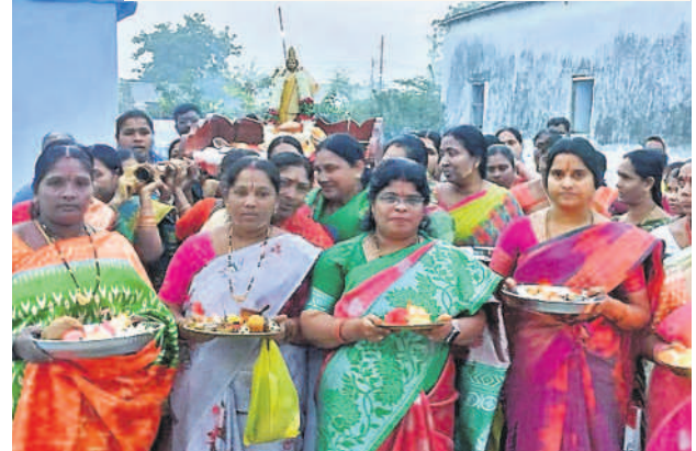
రామన్నపేటలో గోదాదేవి పల్లకి సేవలో పాల్గొన్న మహిళలు