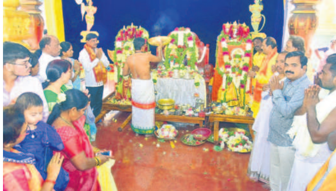
భువనగిరి సిటీ : భువనగిరి గోదా రంగనాథ స్వామి ఆలయంలో పూజలు చేస్తున్న భక్తులు