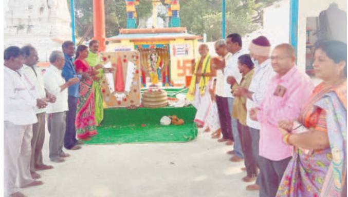
మోతూరు : రామలింగేశ్వర స్వామి ఆలయంలో పూజల్లో పాల్గొన్న భక్తులు

స్వామివారి అధ్యయనోత్సవాలలో భాగంగా ప్రధానాలయంలో స్వామివారు ఆదివారం ఉదయం వేణుగోపాల స్వామి అలంకారంలో, సాయంత్రం గోవర్ధనగిరి దారి అలంకార సేవలో భక్తులకు దర్శనమివ్వనున్నారు.