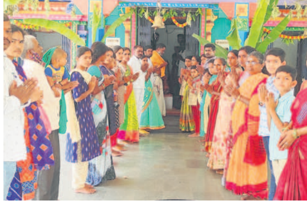
ఆత్మకూరు(ఎం)లోని శివాలయంలో పూజలు చేస్తున్న భక్తులు