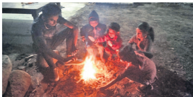
రంగారెడ్డి జిల్లా చౌదరిగూడ మండలం గుర్రంపల్లిలో చలిమంట కాచుకుంటున్న చిన్నారులు