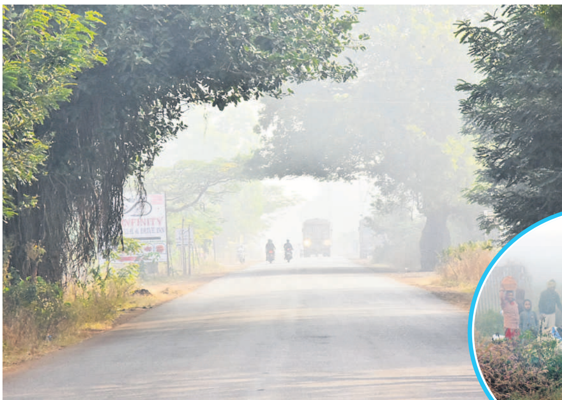
వికారాబాద్ కు వెళ్లే రోడ్డులో..