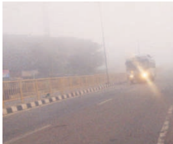
పరిగి : లైట్లు వేసుకొని వస్తున్న బస్సు