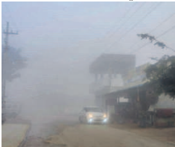
మొయినాబాద్ : శ్రీరాంనగర్ వెళ్లే రోడ్డులో..