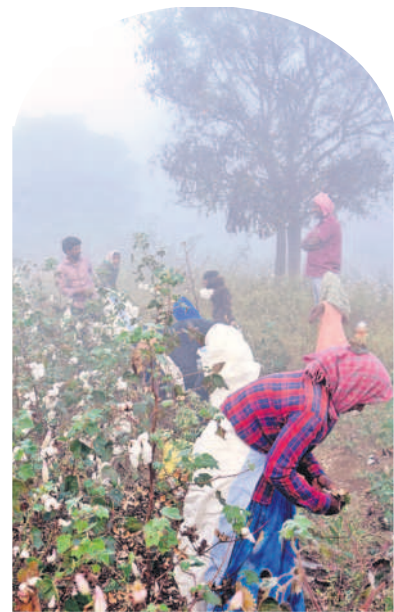
చలిలో పత్తిని తీస్తున్న కూలీలు