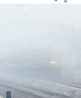
పాదనగర్ : లైట్లు వేసుకుని వెళ్తున్న రైలు