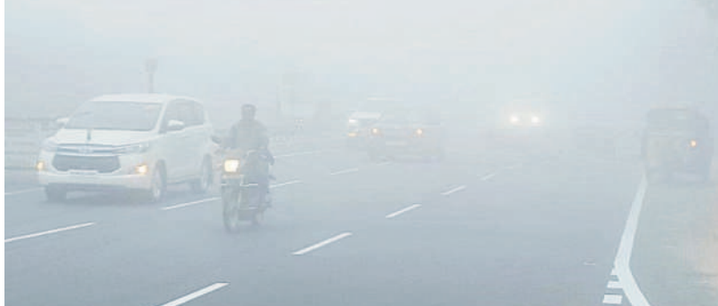
పాదనగర్ బైపాస్ రోడ్డులో లైట్లు వేసుకుని వెళ్తున్న వాహనాలు