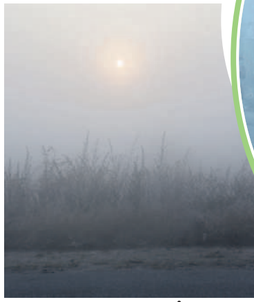
శంకర్ పల్లి పొలాల్లో