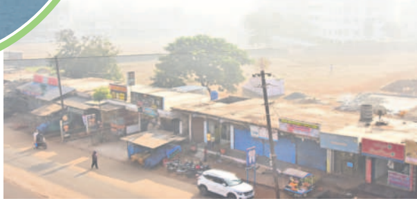
పొగమంచులో వికారాబాద్ పట్టణం