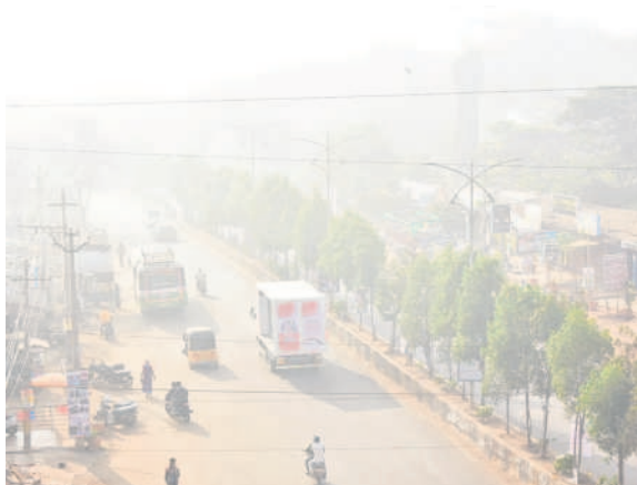
వికారాబాద్ ప్రధాన రహదారి