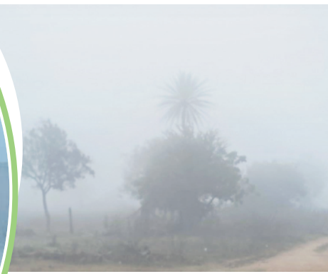
పాదనగర్ లో పొగమంచు