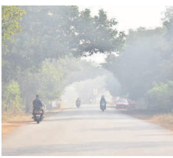
అనంతగిరి పోయే రోడ్డు