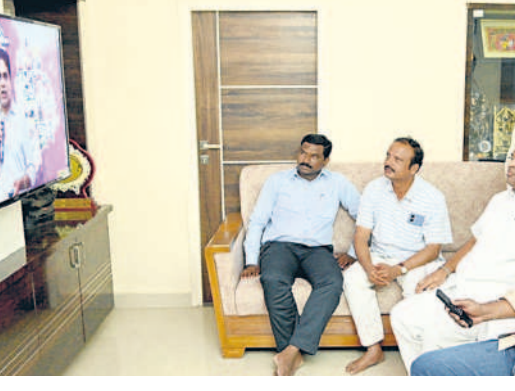
నల్లగొండలో స్వేద పత్రం కేటీఆర్ ప్రజెంటేషన్ ను టీవీలో వీక్షిస్తున్న ప్రజలు