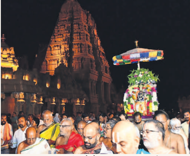
యాదగిరిగుట్ట మాడ వీధుల్లో గోవర్ధనగిరిగా స్వామివారి ఊరేగింపు