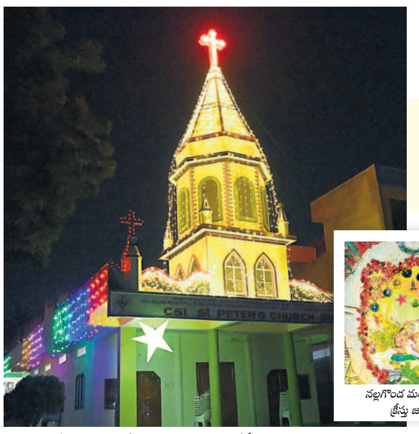
సూర్యాపేట నెహ్రూనగర్ లో వీధుల్లోపాల అలంకరణలో సీఎన్ ఐ చర్చి