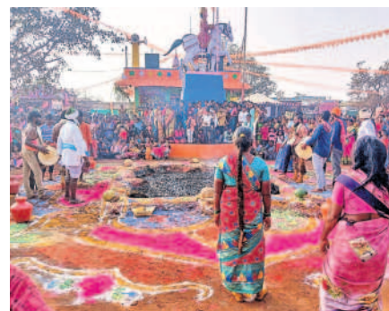
కోహిర్: బిలాల్ పూర్ లో అగ్నిగుండ ప్రవేశం చేస్తున్న భక్తులు