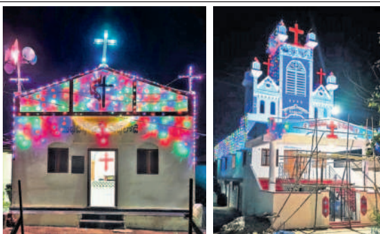
మునిపల్లి: విద్యుత్ బీహెచ్ అలంకరణలో చర్చిలు