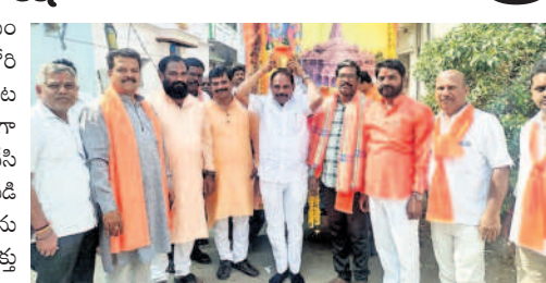
సదాశివపేటలో అయోధ్య రాముడి అక్షింతలను శోభాయాత్రగా తీసుకెళ్తున్న భక్తులు