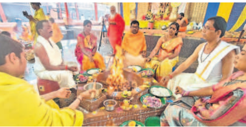
దత్త, చండీయాగంలో పాల్గొన్న రుత్విక్తులు