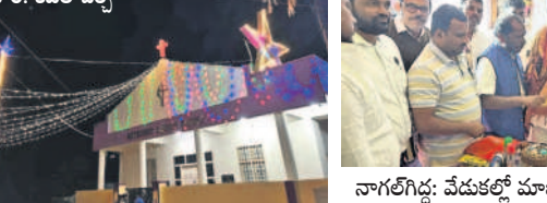
కోహిర్: కవేలి చర్చి