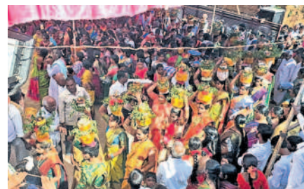
సజ్జాపూర్ లో అమ్మ వారి ఆలయానికి బోనాలతో ఊరేగింపుగా వస్తున్న మహిళలు