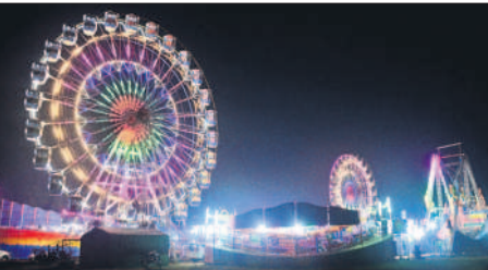
మెడక్ చర్చి ఆవరణలో రంగుల రాటూలు

చర్చి. ఇది కల్లోల జగతికి శాంతి సందేశాన్ని అందించిన కరుణామయుడి మందిరమే కాదు.. అన్నార్థాలను ఆదుకునే మహోన్నత ఆశయంతో రూపుదిద్దుకొన్న మహాదేవాలయం. కరువు నుంచి ఉద్భవించిన కళాత్మక కట్టడం. సుందరమైన మెడక్ చర్చికి ఘనమైన పరిశ్రమ ఉంది. కరుణామయుడి మందిరంలో ఆర్చీలు, ఫైకప్పు, ఫ్లోరింగ్ మాత్రమే కాదు.. వేదికపై టేబుళ్లు, కుర్చీలు సైతం ఎంతో కళాత్మకంగా ఉంటాయి. ప్రధాన వేదికపై ఉండే ప్రభు భోజనపు టేబుల్ రంగూన్ టేబుల్ కళాత్మకంగా తయారు చేయబడింది. పరిశుద్ధ గ్రంథమైన బైబిల్ పఠన వేదిక దేవదారు కర్రతో పక్షి రాజు రూపంలో ఎంతో అద్భుతంగా మలచారు. జెకోస్లోవేకియా దేశానికి చెందిన కలప పనివారు చాలారోజుల పాటు శ్రమించి దీనిని అసలైన పక్షిని తలపించేలా రూపొందించడం వారి పతనానికి నిదర్శనం. గురువులు ఆసీనులయ్యే బల్కలు, కుర్చీలు గులాబీ కర్రతో తయారు చేశారు.