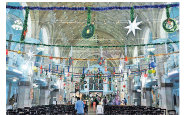
క్రీస్తున్ వేడుకలకు ముస్తాబైన చర్చి