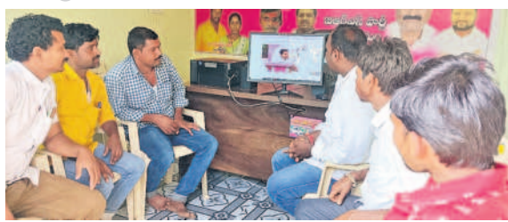
మల్లీశ్ టీవీ ప్రసారాలను వీక్షిస్తున్న బీఆర్ఎస్ శ్రేణులు