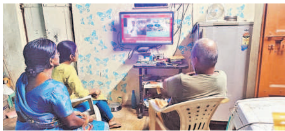
మున్సిపాలిటీ కేటీఆర్ పవర్ పాయింట్ ప్రజెంటేషన్లను టీవీలో వీక్షిస్తున్న ఓ కుటుంబం