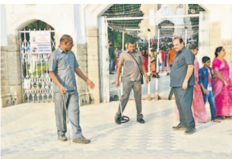
ఆదివారం చర్చి ప్రాంగణంలో తనిఖీ చేస్తున్న డాగ్ స్వాచ్ బృందం