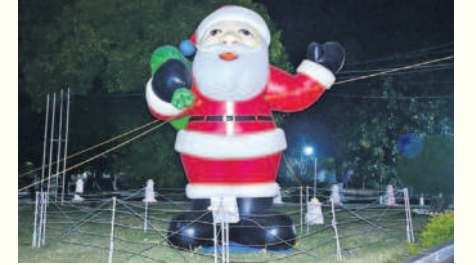
మెడక్ చర్చి ప్రాంగణంలో ఏర్పాటు చేసిన శాంతాకాళాడే

అంచనా. 360 ఎకరాల విస్తీర్ణంలో ప్రహారీ మద్దలో చర్చిని నిర్మించారు. చర్చి ఆఫ్ సౌత్ ఇండియా (సీఎస్ఐ) పరిధిలో మొత్తం 22 డయాసీస్లు ఉన్నాయి. అందులో మెడక్ డయాసీస్ ఒకటి. 1947 సెప్టెంబర్ 30న ఇది ఆవిర్భవించింది. దీని పరిధిలో మెడక్, నిజామాబాద్, ఆదిలాబాద్, రంగారెడ్డి, హైదరాబాద్ జిల్లాలు ఉన్నాయి. ఆవిర్భావం నుంచి ఇప్పటి వరకు మెడక్ బిషప్లుగా తొమ్మిది మంది చేశారు.