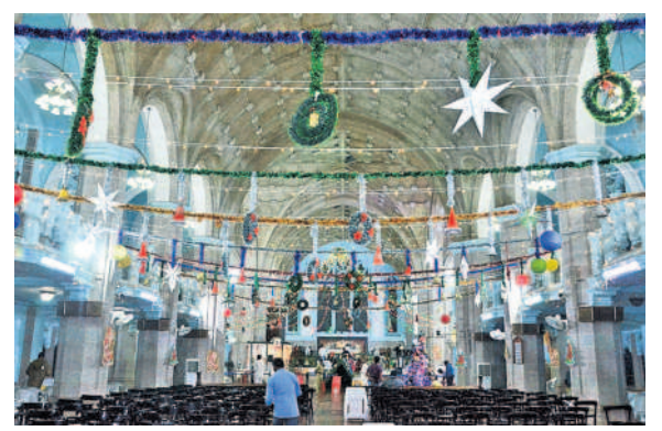
క్రీస్తున్ వేడుకలకు ముస్తాబైన చర్చి