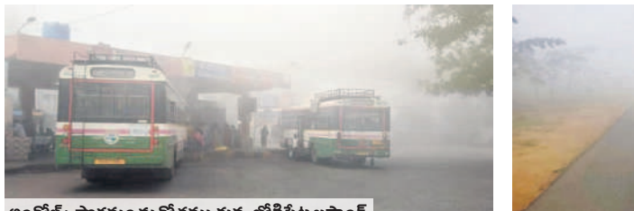
అందోల్ : పొగమంచుతో కమ్మకున్న జోగిపేట బస్టాండ్

అందోల్/కొల్హారం, డిసెంబర్ 24 : రోడ్లను పొగమంచు కమ్మేసింది. ఆదివారం ఉదయం రోడ్డు మొత్తం మంచుతో కమ్మేసి కస్టీర్ను తలపించింది. ఉదయం 9దాటినా సూర్యుడు కనబడలేదు. దీంతో వాహనాల రాకపోకలకు తీవ్ర ఇబ్బందులు ఎదురయ్యాయి. తప్పనిసరి పరిస్థితిలో హెడ్లైట్ల వెలుతురులో వాహనాల రాకపోకలు సాగించారు. జోగిపేట క్లాక్ టవర్, జోగినా ధాలయం, రంగనాథ ఆలయం, బస్టాండ్, కొల్హారంలో దట్టమైన పొగమంచు కమ్మేయడంతో పలువురు ఈ దృశ్యాలును సెల్ ఫోన్లో చిత్రీకరించారు.