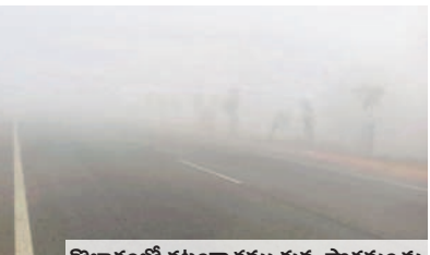
కొల్హారంలో దట్టంగా కమ్మకున్న పొగమంచు