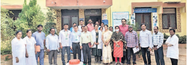
కొండాపూర్ మండల వైద్య సిబ్బందితో కేంద్ర అధికారులు