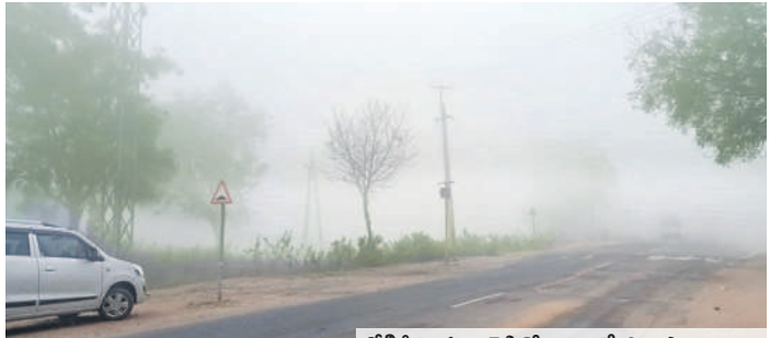
జోగిపేట-సంగారెడ్డి రోడ్డును కమ్మేసిన పొగమంచు

అందోల్/కొల్హారం, డిసెంబర్ 24 : రోడ్లను పొగమంచు కమ్మేసింది. ఆదివారం ఉదయం రోడ్డు మొత్తం మంచుతో కమ్మేసి కస్టీర్ను తలపించింది. ఉదయం 9దాటినా సూర్యుడు కనబడలేదు. దీంతో వాహనాల రాకపోకలకు తీవ్ర ఇబ్బందులు ఎదురయ్యాయి. తప్పనిసరి పరిస్థితిలో హెడ్లైట్ల వెలుతురులో వాహనాల రాకపోకలు సాగించారు. జోగిపేట క్లాక్ టవర్, జోగినా ధాలయం, రంగనాథ ఆలయం, బస్టాండ్, కొల్హారంలో దట్టమైన పొగమంచు కమ్మేయడంతో పలువురు ఈ దృశ్యాలును సెల్ ఫోన్లో చిత్రీకరించారు.