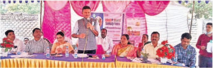
పటాన్చెరు మండలం కర్లనూర్లో మాట్లాడుతున్న కేంద్ర ఆరోగ్యశాఖ కార్యదర్శి కమల్ వర్ధన్ రావు

పటాన్చెరు, డిసెంబర్ 24 : చిరుధాన్యాల ఆరోగ్యనిస్సాయిని కేంద్ర ఆరోగ్యశాఖ కార్యదర్శి కమల్ వర్ధన్ రావు అన్నారు. ఆదివారం పటాన్చెరు మండలం కర్లనూర్ గ్రామంలో కేంద్ర ప్రభుత్వ ఆధ్వర్యంలో వికసిత భారత్ యాత్రలో భాగంగా సభను నిర్వహించారు. ఈ సందర్భంగా ఆయన మాట్లాడుతూ కేంద్ర ప్రభుత్వం అనేక పథకాలు ప్రవేశపెట్టినదన్నారు. అందరి ఆరోగ్యాలకు భరోసా కల్పించే అభి కార్యాల తీసుకోవాలని ప్రజలను కోరారు. రూ.5లక్షల వరకు చికిత్స ఉచితంగా లభిస్తున్నదన్నారు. చిరుధాన్యాల వాడకం పెరగాలన్నారు. మిల్లెట్స్ సాగును ప్రోత్సహిస్తున్నామన్నారు. ఈ ఏడాది అంతర్జాతీయ మిల్లెట్స్ ఇయర్ గుర్తించడంతో మిల్లెట్స్కు ప్రాధాన్యత ఇస్తున్నామన్నారు. 14.5 మిలియన్ మెట్రిక్ టన్నుల చిరుధాన్యాల దేశంలో పండుతున్నాయని, వాటిని 25 మిలియన్ మెట్రిక్ టన్నులుగా పెంచేందుకు కార్యచరణ రూపొందిస్తున్నామన్నారు.