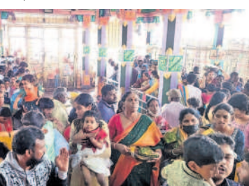
క్యాలిన్లో భక్తుల సందడి