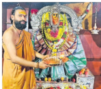
పూజలు అందుకుంటున్న వనదుర్గా భవానీమాత

పాపన్నపేట, డిసెంబర్ 24 : ఏడు పాయల వనదుర్గా భవానీమాత సన్నిధిలో ఆదివారం పెద్దఎత్తున భక్తుల సందడి నెలకొంది. క్రిస్మస్ పండుగను పురస్కరించుకొని వరుస సెలవులు రావడంతో పలు ప్రాంతాల నుంచి భక్తులు తరలివచ్చి