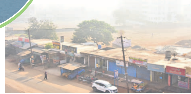
పొగమంచులో వికారాబాద్ పట్టణం