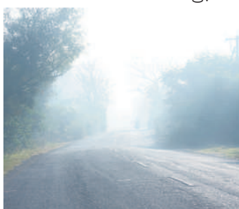
మొయినాబాద్ మండలం రెడ్డిపల్లి రోడ్డు