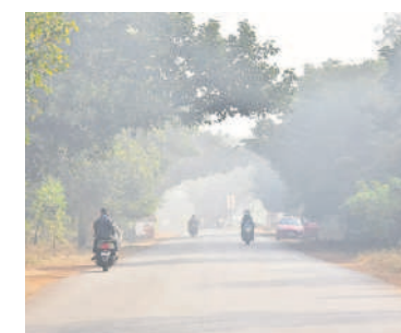
అనంతగిరి పోయే రోడ్డు