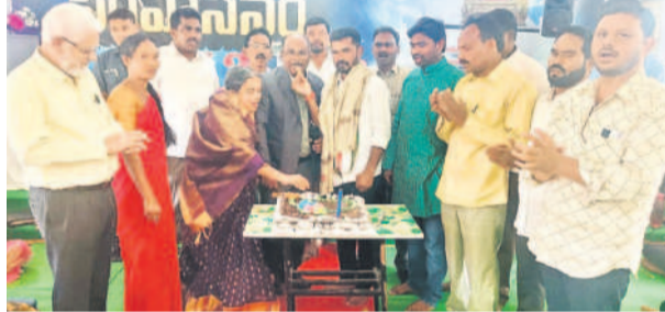
ఉమ్మార రూరల్ : లభ్యంలోని చర్చిలో కేక్ కట్ చేస్తున్న ఖానాపూర్ ఎమ్మెల్యే బొబ్బి