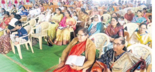
ఆదిలాబాద్ జిల్లాకేంద్రంలోని రవీంద్రనగర్ వస్తీ పేటర్, చర్చిలో..