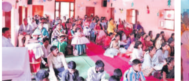
ఖానాపూర్ : సీఎస్ఐ చర్చిలో ప్రార్థనలు చేస్తున్న.