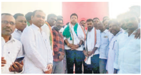
అమరవీరుల స్మారక వద్ద నివాళులర్పిస్తున్న మంత్రి శ్రీధర్ బాబు

ఇంద్రవెల్లి, డిసెంబర్ 25 : ఆదిలాబాద్ జిల్లా ఇంద్రవెల్లి మండలంలోని హీరా పూర్ వద్ద గల అమరవీరుల స్మారకాన్ని సోమవారం సాయంత్రం స్థానిక ఎమ్మెల్యే వెంకటేశ్వర్లు పట్టే లతో కలిసి బి.టి. పరిశ్రమల శాఖ మంత్రి దుద్దికొండ శ్రీధర్ బాబు సందర్శించారు.