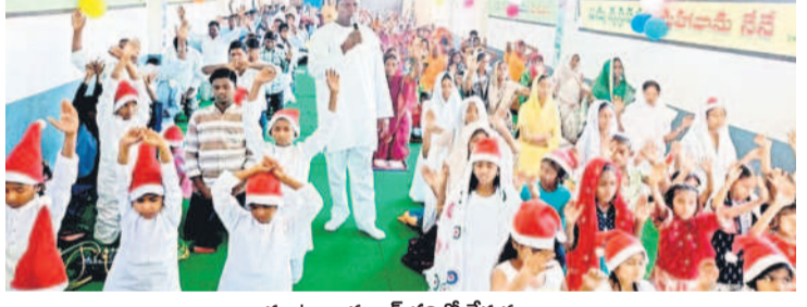
కుంటూరు : కల్యాణ్ చర్చిలో వేడుకలు

కరుణామయుడు, శాంతిదాత యేసుక్రీస్తు జన్మదినం సందర్భంగా సోమవారం ఆదిలాబాద్, నిర్మల్ జిల్లాల్లో క్రీస్మస్ వేడుకలు ఘనంగా కొనసాగాయి. క్రైస్తవులు పెద్ద సంఖ్యలో చర్చిలకు చేరుకొని ప్రత్యేక ప్రార్థనలు చేయగా, పాస్టర్ల దైవ సందేశాన్ని వినిపించారు. హ్యాపీ క్రీస్మస్.. మేరీ మేరీ క్రీస్మస్.. అంటూ క్రీస్తును స్తుతిస్తూ గీతాలు ఆలపించారు. కేక్స్ కట్ చేసి.. మిఠాయిలు పంపిణీ చేశారు. ఆయా చోట్ల ప్రజాప్రతినిధులు, అధికారులు పాల్గొని సుఖానందాలు తెలిపారు.