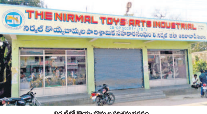
నిర్మల్ లో కొయ్య బొమ్మల పరిశ్రమ భవనం

హరితహారం పథకంలో భాగంగా పానికి మొక్కల ప్లాంటేషన్లను పెద్ద ఎత్తున చేపట్టడంపై కార్యచరణ సిద్ధం చేసింది. మొక్కల పెంపకానికి అనువైన ప్రాంతాలూ మూడు మండలంలోని కొరిటిల్, గాయద్పెల్లి, వాస్తాపూర్, లింగాపూర్, తోటిగూడ గ్రామాలను ప్రయోగాత్మకంగా ఎంపిక చేసింది. మొదట లింగాపూర్ గ్రామ శివారులోని ప్రభుత్వ భూమిలో హరితహారం కింద 1000 పానికి మొక్కలు నాటారు. అలాగే వాస్తాపూర్, గాయద్పెల్లి గ్రామాల్లో ధనఅవారీగా పెంపకాన్ని చేపట్టాలని నిర్ణయించారు. కేంద్రంలోని బీజేపీ ప్రభుత్వం ఎన్నికల సమయంలో ఇచ్చిన హామీ కట్టుబడి పరిశ్రమను ఆదుకుని చర్యలు చేపట్టాలని కళాకారులు కోరుతున్నారు.