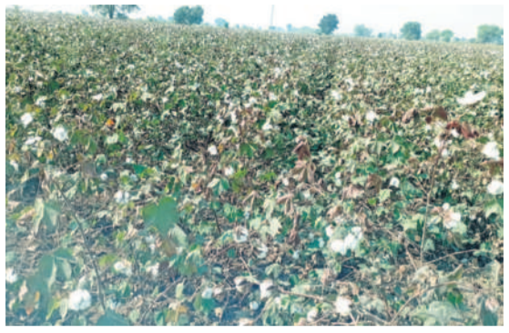
భీంపూర్ మండలంలోని నివాసి శివారంలో గల చెనులో పత్తి

అనంతరం 1981 ఏప్రిల్ 20వ తేదీన అమరయైన వీరులకు నివాళులర్పించారు. స్మారక వద్ద స్మృతివసం ఏర్పాటు చేస్తున్నట్లు మంత్రికి ఎమ్మెల్యే వివరించారు. ఈ కార్యక్రమంలో నాయకులు పాల్గొన్నారు.