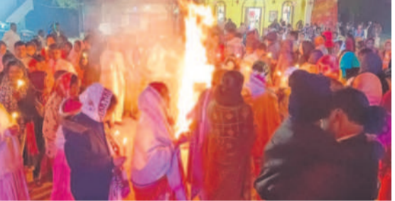
ఇంద్రవెల్లి : క్యాండ్లీ వెలిగించి స్మృతిం చేస్తున్న.