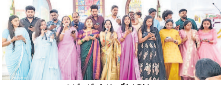
నిర్మల్ లో అర్చన : ప్రార్థనలు చేస్తున్న క్రైస్తవులు