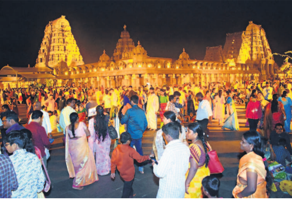
యాదగిరిగట్టు లక్ష్మీనరసింహస్వామి అలయంలో స్వామివారి అభయనోత్సవాలు ఆగమకార్యం ప్రకారం వైభవంగా కొనసాగుతున్నాయి. ఇందులో భాగంగా యాదగిరికు సోమవారం ఉదయం శ్రీరాముడు, సాయంత్రం వేంకటేశ్వరుడి అవతారంలో భక్తులకు దర్శనమిచ్చారు. తిరువీధుల్లో స్వామివారి అలంకార సేవలు నిర్వహించారు. వరస నిలవలకు రావడంతో యాదగిరిగట్టుకు భక్తులు పోలివారు. -యాదగిరిగట్టు