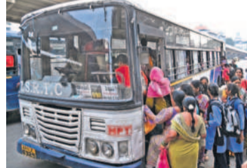
విజయనగరం, అయితే ఈ విషయంపై ఏమైనా ప్రతిరేకత వస్తుందా.. లేదా.. అన్ని మీమాంసన అధికారులతో నెలకొన్నది. ఎందుకంటే దేశంలో ఇప్పటి వరకూ మహిళలకే తప్ప పురుషులకు ఇలా సీట్లు రిజర్వ్ చేసిన దాఖలాలు ఎక్కడా లేవు.

డిపోల వారిగా అభిప్రాయాల సేకరణ ప్రతి బస్సులోనూ మొత్తం 55 సీట్లలో 20 సీట్లు పురుషులకు రిజర్వ్ చేసి అంశాన్ని అర్జీని ఉన్నతాధికారులు తీవ్రంగా పరిశీలిస్తున్నారు. ఈ మేరకు అన్ని డిపోల నుంచి వివరాలు పంపాలని కోరుతూ ఆడి శాలు జారీ చేశారు. ముఖ్యంగా డిపో మేనేజర్ల అభిప్రాయాలను తప్పనిసరిగా తెలుసుకోవాలన్నారు. డిపోల వారిగా నివేదికలు వచ్చాక పురుషులకు రిజర్వ్ సీట్లు అంతర్జాతీయ బీసీ అర్జీని సర్వయం తీసుకోవాలని, దీంతో ఒకప్పుడు మహిళలకు కేటాయిం చినట్లుగానే ఇప్పుడు పురుషులకు బస్సుల్లో రిజర్వ్ సీట్లు కేటాయిం చే అంశంపై చర్చనీయాంశంగా మారింది. దేశ చరిత్రలోనే విస్తృతం రాష్ట్రంలో అర్జీని బస్సుల్లో పురుషులకు ప్రత్యేక సీట్లు కేటాయిం ఇది దేశంలో విస్తృతం అంశంగా