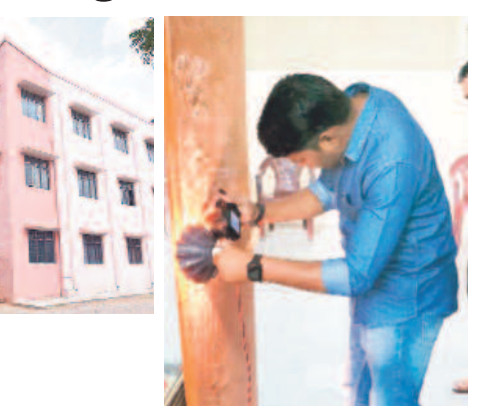
అధికారులు సేకరిస్తున్న క్లాస్ టీం

కరీంనగర్ రాంగల్, డిసెంబర్ 25: కరీంనగర్ లిజిస్ట్రేషన్ కార్యాలయంలో చోరీ కలకలం రేపుతున్నది. ఆదివారం రాత్రి గుర్తు తెలియని దుండగులు చోరీకి పాల్పడినట్లు తెలుస్తున్నది. నెలల దినం కావడంతో ఉదయం వాచ్మెన్ అటుగా వెళ్లి చూసే సరికి గొర్రె విరిగి, తాళం కింద పడి ఉన్నది. ఆనుమానం వచ్చి అధికారులకు సమాచారం అందించడంతో వెంటనే ఆక్సిడిడ్ కార్యాలయం సిబ్బంది చేరుకున్నారు. ఆ వెంటనే వన్ టౌన్ పోలీసులు అక్కడికి చేరుకొని దర్యాప్తు ప్రారంభించారు. సాధారణ చోరీ వలే గొర్రె విరిగి పడి ఉండడంతో దొంగల ముఠా పనే అయి ఉంటుందని భావించి క్లాస్ టీం నిపుణులను పిలిపించారు. వెంటనే రంగంలోకి దిగిన క్లాస్ టీం నిపుణులు కార్యాలయం అంతా క్లుప్తంగా పరిశీలించి వేరువేరు సేకరించారు. కార్యాలయం సిబ్బందితో మాట్లాడి అధికారులను పిలిపించి లోపల ఉన్న సీన్ కెమెరాల ఫుటేజీని కూడా పరిశీలించారు. రాత్రి 11.30 గంటల సమయంలో ఒక వక్రీ లోపలికి ప్రవేశించినట్లు రికార్డు కావడంతో దాని ఆధారంగా దర్యాప్తు చేపట్టారు. మరికొన్ని సీన్ కెమెరాల ఫుటేజీ కూడా పరిశీలించి నిందితుడి ఆనవాళ్లకు అవకాశమున్నది. ఇదిలా ఉంటే మొత్తం రిజిస్ట్రేషన్ రికార్డులన్నీ డిజిటలైజ్ చేశామని, మ్యానివల్ రికార్డు పోపడం వల్ల జరిగి నష్టమేమీ లేదని చెబుతున్నారు. ప్రాథమిక పరిశీలనలో నిందితుడు కేవలం ఒక రికార్డును మాత్రమే తీసుకెళ్లినట్లు తెలడంతో కావాలనే ఈ దొంగకూసాని పాల్పడి ఉంటారని పోలీసులు భావిస్తున్నారు.