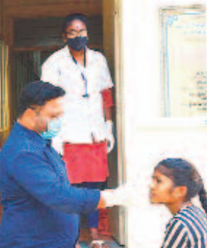
ప్రభుత్వ దవాఖానలో ఆర్థోపీడియట్ వరకల్ వేస్తున్న వైద్యనిపుంధి

అయ్యప్ప స్వామిలూ జాగ్రత్త కొత్త వేరియంట్ జేఎన్-1 ఎక్కువగా కేరళ రాష్ట్రంలో విజృంభిస్తున్నది. ఈ నేపథ్యంలో శబరిమలకు వెళ్లే భక్తులు తగు జాగ్రత్తలు తీసుకోవాలని వైద్యులు సూచిస్తున్నారు. తప్పనిసరిగా మాస్కులు ధరించాలని, గుంపులు గుంపులుగా వెళ్లవద్దని చెబుతున్నారు. మహారాష్ట్ర, కర్ణాటక వంటి ఇతర రాష్ట్రాలకు వెళ్లే వచ్చిన వారు, విదేశాల నుంచి వచ్చిన వారు తప్పని సరిగా కొవిడ్ పరీక్ష చేసుకోవాలని, జాగ్రత్తగా ఉండాలని వైద్యులు చెబుతున్నారు. ఈ వైరస్ ఎక్కువ మందికి సోకే ప్రమాదం ఉంటుందని హెచ్చరిస్తున్నారు. అయితే ఇప్పటి వరకు సోకిన వారిలో వైరస్ ప్రభావం అంతగా లేదని, దీని తీవ్రతపై ఇంకా ఒక అంచనాకు రాలేదని చెబుతున్నారు. అయినా ముందు జాగ్రత్తలు తీసుకోవాల్సిన అవసరముందని, దీర్ఘకాలిక వ్యాధిగ్రస్తులు ఇమ్మునిటీని పెంచుకుంటే మంచిదని వైద్యులు సూచిస్తున్నారు.