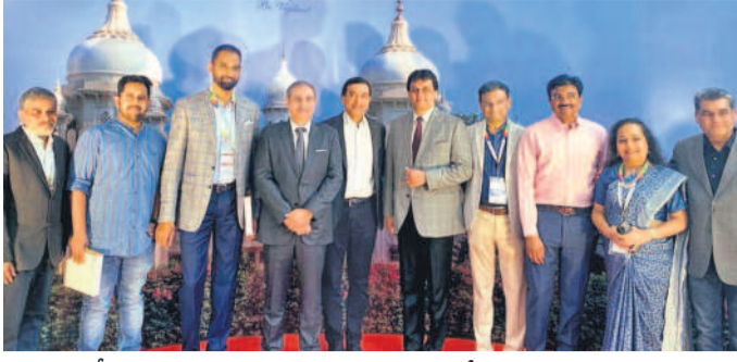
హెచ్ఎస్సర్ స్టాఫ్ ఎక్స్ ఆంక్రమిన్యూర్షివ నమిటలో పాల్గొన్న పూర్వ విద్యార్థులు