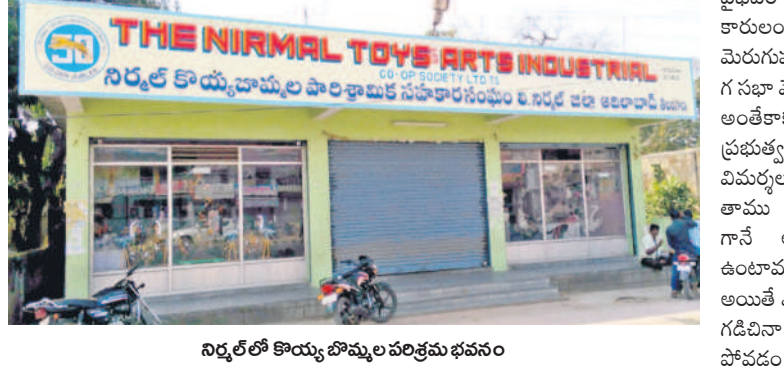
నిర్మల్లో కొయ్య బొమ్మల పరిశ్రమ భవనం