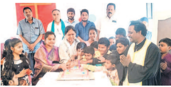
అసిఫాబాద్ టౌన్ : చిన్నారులతో కలిసి కేక్ కట్ చేస్తున్న ఎమ్మెల్యే కోనేరు లక్ష్మి

కరుణామయుడు, శాంతిమాత యేసుక్రీస్తు జన్మదినం సందర్భంగా సోమవారం అసిఫాబాద్, మంచిర్యాల జిల్లాల్లో క్రిస్టన్ వేడుకలు ఘనంగా నిర్వహించారు. క్రిస్టన్ పూజలు, బైబిల్ పఠనం, ప్రత్యేక ప్రార్థనలు చేయగా, పాస్టర్ల ద్వారా సందేశాలు అందించారు. హ్యాపీ క్రిస్టన్.. మేరీ మేరీ క్రిస్టన్.. అంటూ క్రిస్టన్ సుత్తిస్తూ గీతాలు ఆలపించారు. కేక్ కట్ చేసి.. మిఠాయిలు పంపిణీ చేశారు. ఆయా చోట్ల ప్రజాప్రతినిధులు, అధికారులు పాల్గొని శుభాకాంక్షలు తెలిపారు.