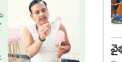
నిర్మల్లో కొయ్య బొమ్మల పరిశ్రమ భవనం