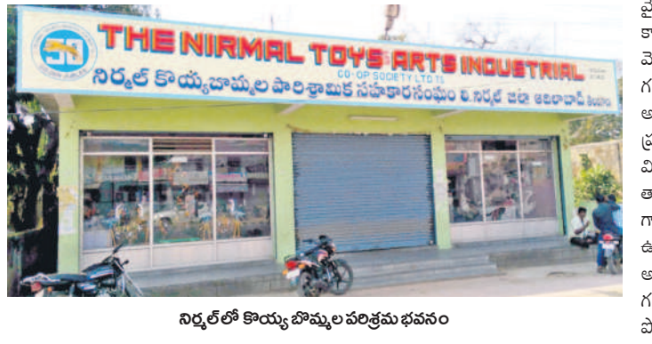
నిర్మల్లో కొయ్య బొమ్మల పరిశ్రమ భవనం

పరిశ్రమ ఉనికికి ముప్పు తప్పదని భావించిన కేసీఆర్ ప్రభుత్వం ఊరటనిచ్చే చర్యలు చేపట్టింది. హరితహారం పథకంలో భాగంగా పానికీ మొక్కల ప్లాంటేషన్లు పెద్ద ఎత్తున చేపట్టడం కార్యచరణ నిర్ణయం చేసింది. మొక్కల పెంపకానికి అనువైన ప్రాంతాలుగా మామడ మండలంలోని కొరిటికల్, గాయద్పెట్టి, వాస్తిపూర్, లింగాపూర్, తోటిగూడ గ్రామాలను ప్రయోగాత్మకంగా ఎంపిక చేసింది. మొదల లింగాపూర్ గ్రామ శివారులోని ప్రభుత్వ భూమిలో హరితహారం కింద 1000 ఎకరాల మొక్కలు నాటారు. అలాగే వాస్తిపూర్, గాయద్పెట్టి గ్రామాల్లో దళితవారిగా పెంపకాన్ని చేపట్టాలని నిర్ణయించారు. కేంద్రంలోని బీజేపీ ప్రభుత్వం ఎన్నికల సమయంలో ఇచ్చిన హామీలకు కట్టుబడి పరిశ్రమను ఆదుకునే చర్యలు చేపట్టాలని కళాకారులు కోరుతున్నారు.