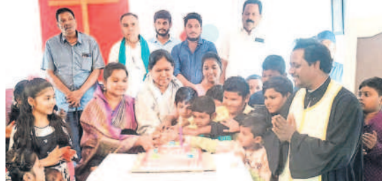
ఆసిఫాబాద్ టౌన్ : చిన్నారులతో కలిసి కేక్ కట్ చేస్తున్న ఎమ్మెల్యే కోనేరు లక్ష్మి

కరుణామయుడు, శాంతిమాత యేసుక్రీస్తు జన్మదినం సందర్భంగా సోమవారం ఆసిఫాబాద్, మంచిర్యాల జిల్లాల్లో క్రిస్టన్ వేడుకలు ఘనంగా నిర్వహించారు. క్రిస్టన్లను పెద్ద సంఖ్యలో చర్చులకు చేరుకొని ప్రత్యేక ప్రార్థనలు చేయగా, పాపక్షయం చేసే సందేశాన్ని అందించారు. హ్యాపీ క్రిస్టన్.. మేరీ మేరీ క్రిస్టన్.. అంటూ క్రిస్టన్లు స్తుతిస్తూ గీతాలు ఆలపించారు. కేక్ కట్ చేసి.. మిఠాయిలు పంపిణీ చేశారు. ఆయా చోట్ల ప్రజాప్రతినిధులు, అధికారులు పాల్గొని శుభాకాంక్షలు తెలిపారు.